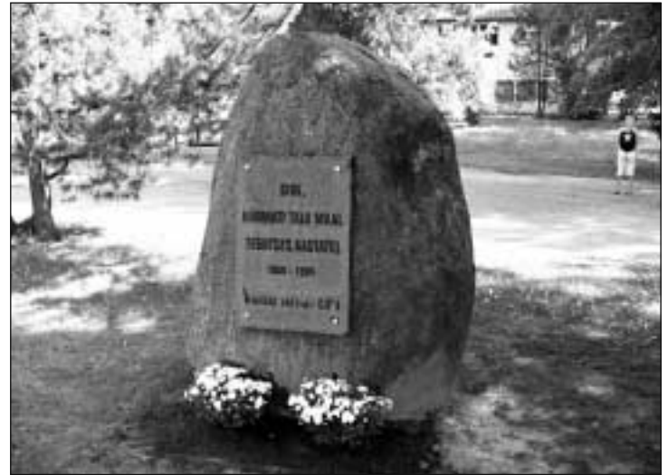
Mälestuskivi Võru EPT-le.