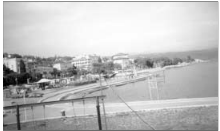
Kuurortlinn Opatija Vahemere ääres.

Reisijuht Viire pakkumine: 1. – 12. mai 2007 , Ventpilsist laevaga Rostockki, edasi Nürnberg, Šveits, Lichtenstein, Milaano, Monaco, Nice (kaks päeva