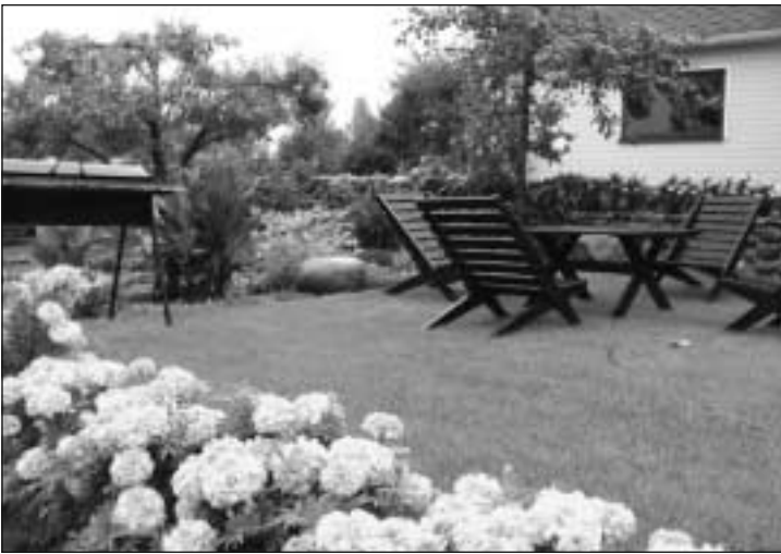
Saarma pere suvila Kosel.