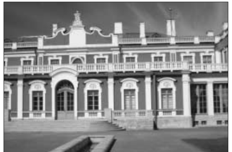
Peetri poolt ehitatud Kadrioru loss.