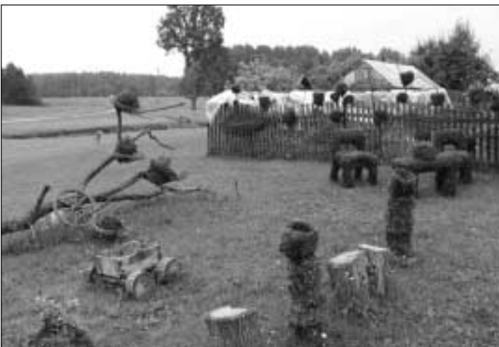
Villa pere põnevad looduskulptuurid. Autor Helin Vill.