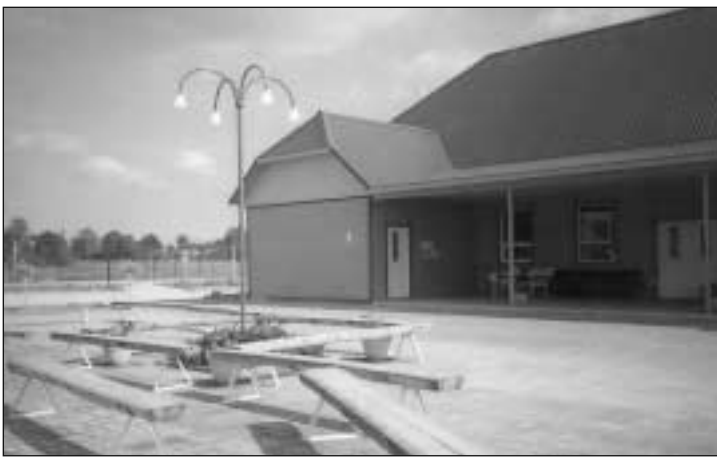
Navi seltsimaja sai sel suvel kalli ja kauni haljastuse.

Kuigi valla heakorraalane üldilme on tugevalt paranenud, on arenemisruumi veel küllaga. Eestkätt sooviksime suuremat huvi asja vastu korteriühistutelt. Igal aastal mõnisada krooni haljastusele ei tee kedagi vaeseks.