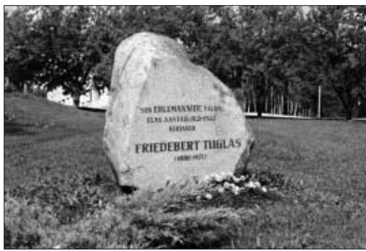
Mälestuskivi Friedebert Tuglasele.