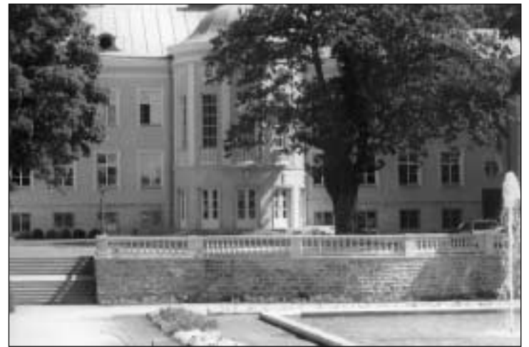
Presidendilossi eestvaade. Paremal 400 aasta vanune tamm.