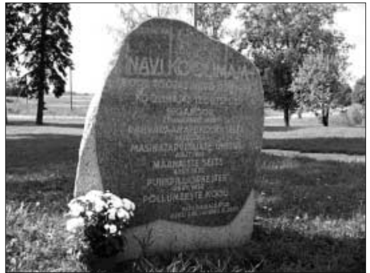
Mälestuskivi Navi koolile.