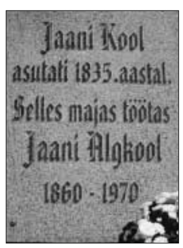
Mälestustahvel Jaani koolile.