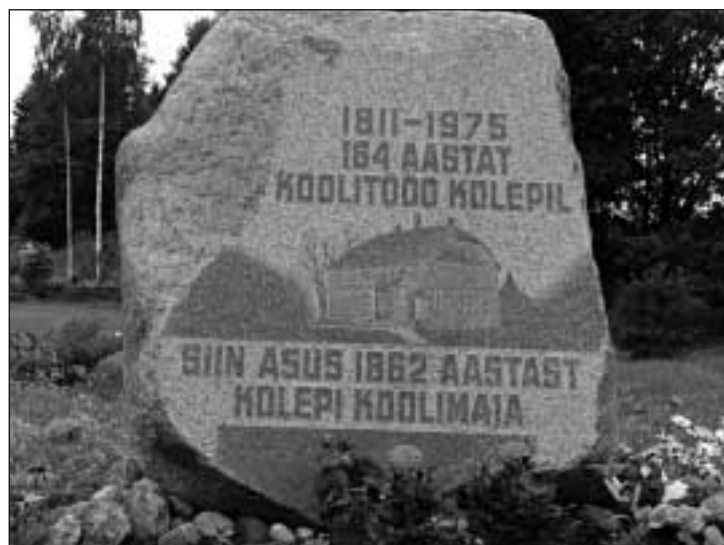
Mälestuskivi Kolepi koolile.