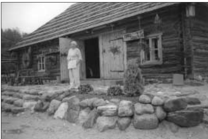
Meegomäel ootab külalisi ja peolaudade tellimusi Hämsa körts. Avatud K-P kella 11-22-ni. Ruumi jagub ka suurtele seltskondadele.

Ka firmad võiksid oma ümbruse kriitilise pilguga üle vaadata. Heakord ei ole rikkuse ega vae-