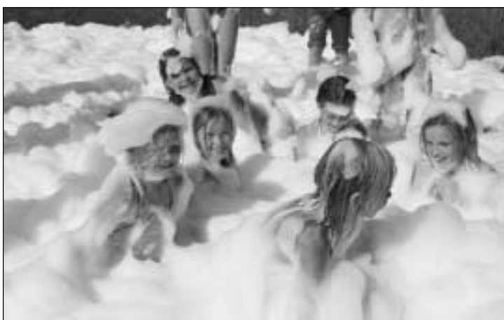
Vahv sees lustida on ju vahva!