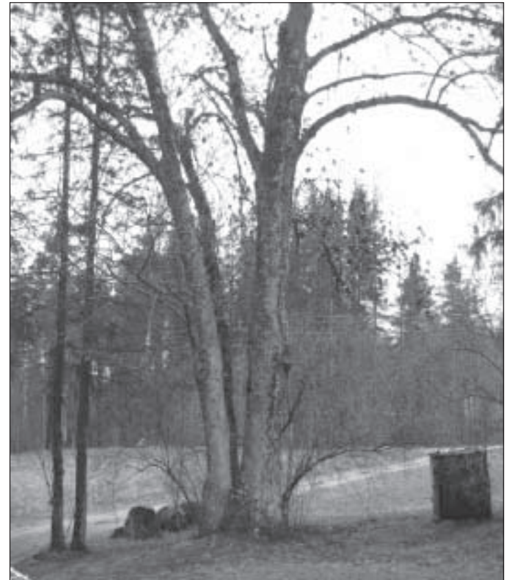
Kevadiselt veel raagus saarepuu.