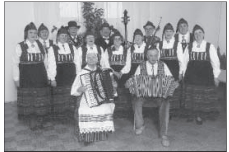
Vannamuudu valmistub nüüd kontserdireisiks Saksamaale.