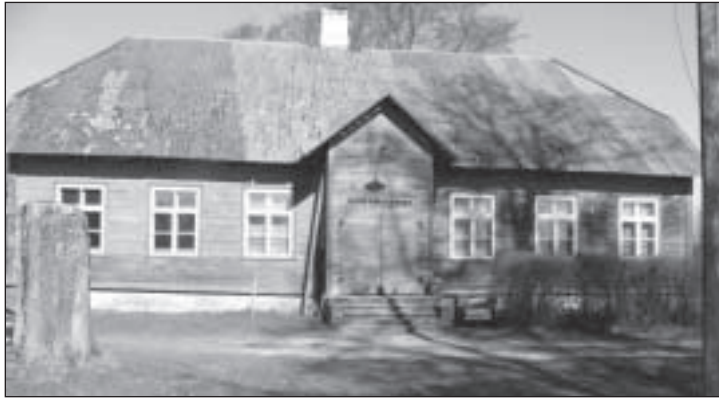
Sammuka koolimaja praegu.