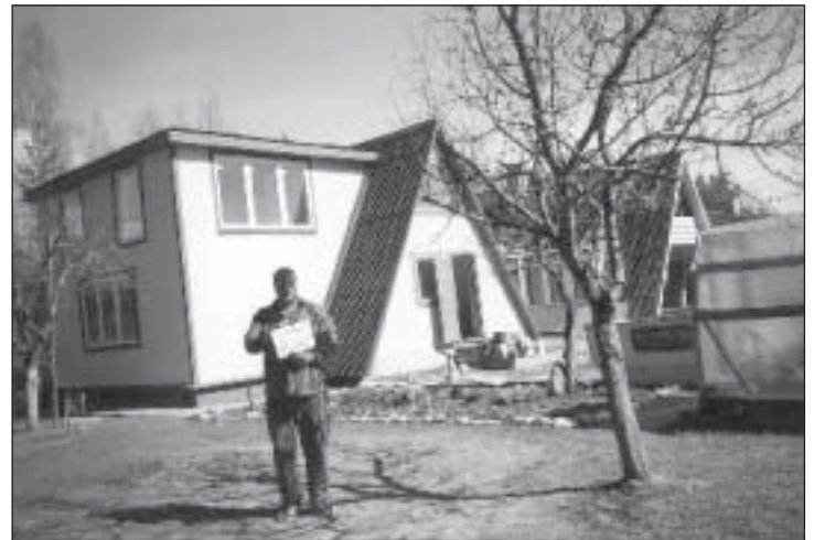
Peremees Denis, kes kingitud valla lehe lubas kohe läbi lugeda.