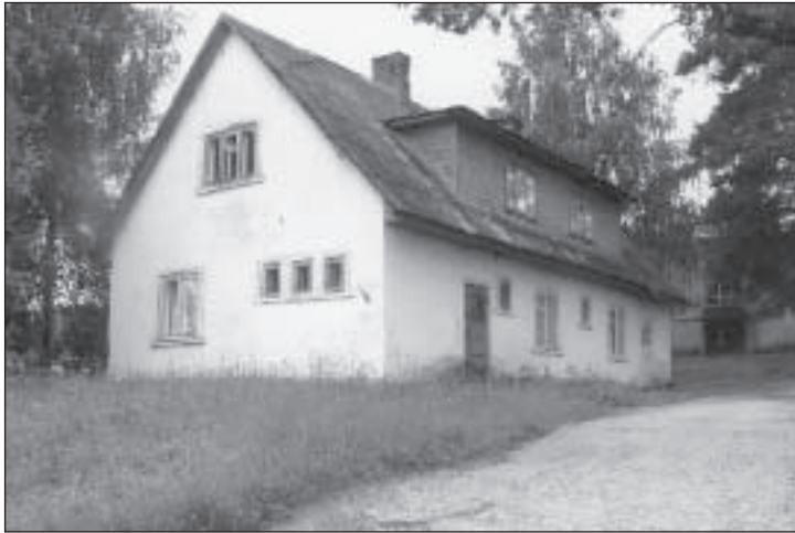
Puiga külas asub praeguseks korralikult remonditud sotsiaalmaja.