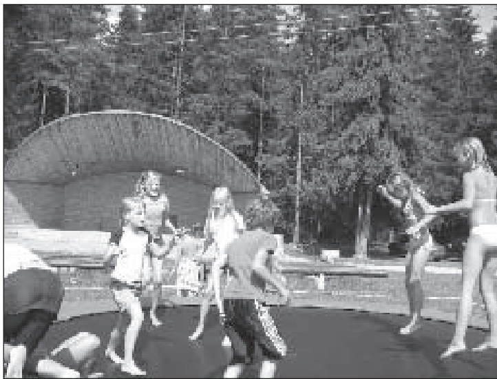
Kõige enam rõõmu pakkus perepäev lastele.

1977. aastal kinnitas tollane Eesti NSV Ülemnõukogu Presiidium Parksepa aleviku staatuse. See tähendab, et tegemist on 30 aasta juubeliga, mida sügisel püüame ka tähistada.