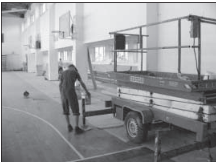
Parksepa keskkooli akende vahetus. Teostaja OÜ Aknapark. Maksumus 238 430 krooni.