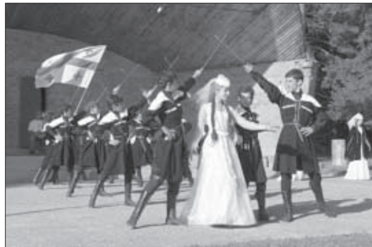
Esineb Gruusia tantsuansambel Bolneli.