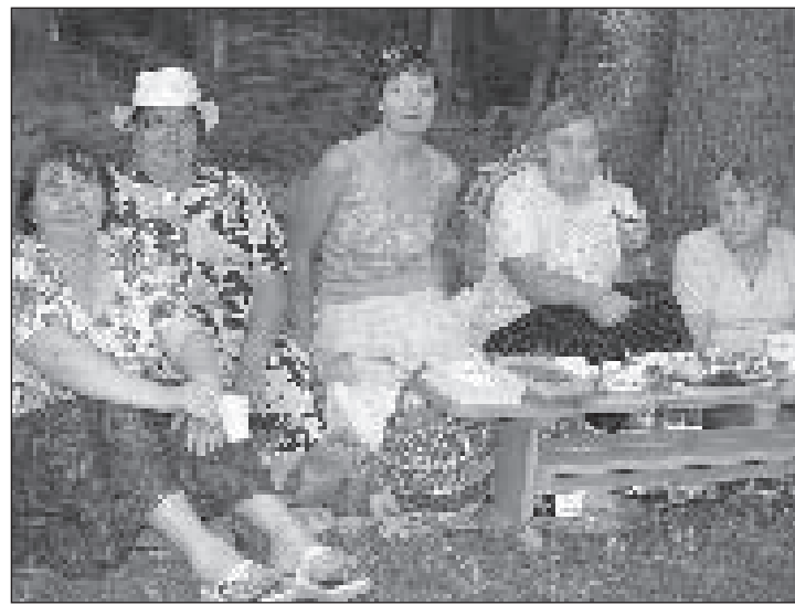
Suguvõsa kokkutulek külapäeval.

MTÜ Aktiivsete Puigalaste Selts juhatuse liige