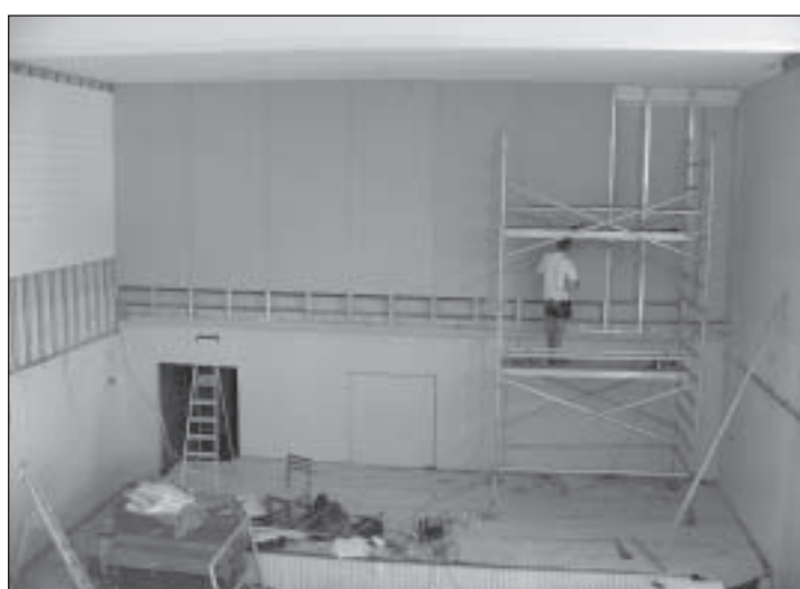
Parksepa keskkooli aula remont. Teostaja OÜ Torel, maksumus 604 778 krooni.