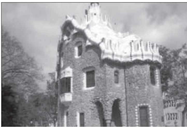
Antonio Gaudi arhitektuurinäidis.

HELGI NOORMETS