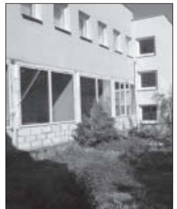
Puiga põhikooli fassaadi remont. Teostaja OÜ Aknapark. Maksumus 738 000 krooni.