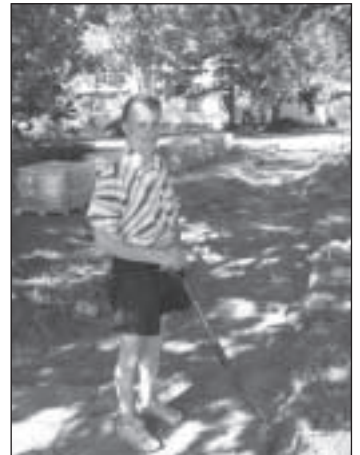
Parksepa keskkooli juures jalgrattatee ehitus. Teostaja OÜ Subrik. Maksumus 20 000 krooni.