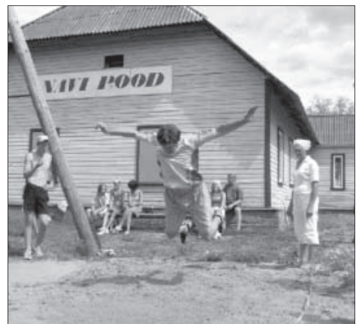
Võistlused hüpetes ja ujumises.