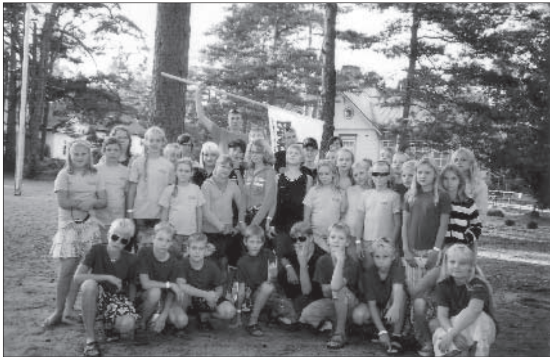
Võidukad Parksepa elokad Klooga suurlaagris suvel 2007.

Eesti noorteühendus ELO tähistab sel aastal oma 20a juubelit. Sama numbriga juubelit võib tähistada ka Võru maakonnas ainuke, Parksepa Keskkooli ELO.