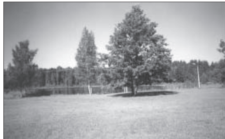
Parksepa rahvas tänab vallavalitsust ilusaks tehtud järveääre eest. Täienduseks tulevad sinna veel mängukohad lastele.

Võru Vallavalitsus Valla heakorrakomisjon