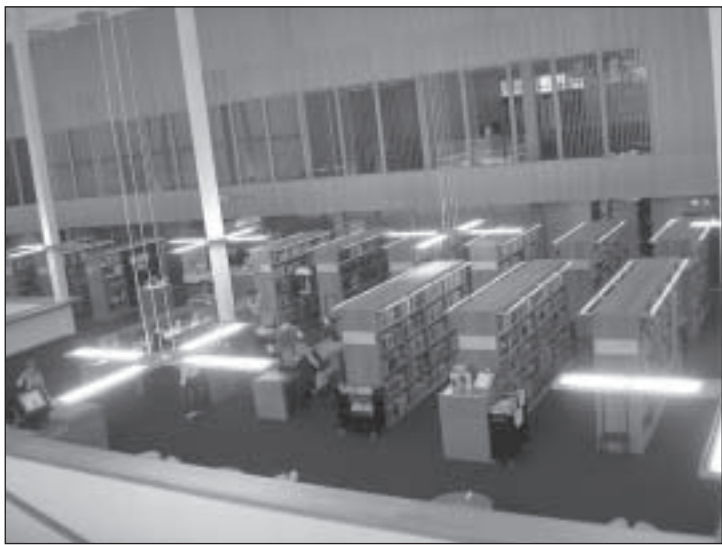
Turu linnaraamatukogu pani kadestama.

Modernses ja avaras Turu Linnaraamatukogus võeti meid soojalt vastu. Mitu lahket raamatukogutöötajat jagasid selgitusi soome keeles, millest me vähe aru saime. Kuid oma silm on kuningas. Eestis paraku sellisele raamatukogule võrdset ei tea. On täielikult automatiseeritud, tehniliselt hästi varustatud, väga heade interneti kasutamise võimalustega. Liftid liiguvad läbi