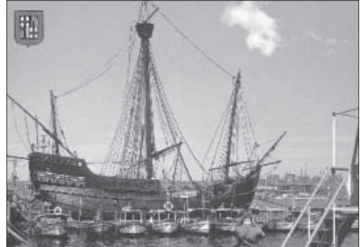
Kolumbuse lipulaev Santa Maria seisab Barcelona sadamas.

2002. aasta kuulutati Hispaanias Gaudi aastaks seoses arhitekti 150. sünniaastapäevaga. Gaudi sündis 25. juunil 1852 väikeses Kataloonia linnakeses Reusis. Õppis Barcelonas arhitektuuri ja 1883. aastal määras-