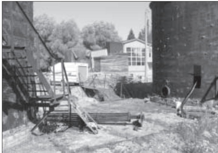
Väimela masuudihoidla likvideerimine. Teostaja Epler & Lorenz. Maksumus 160 000 krooni.