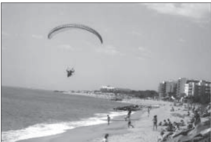
Costa Brava, täpsemalt Malgrat de Mare rand.