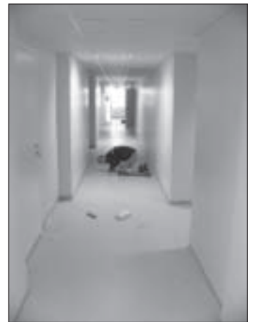
Väimela lasteaia I korruse koridori remont. Teostaja TP Ehitus. Maksumus 253 800 krooni.