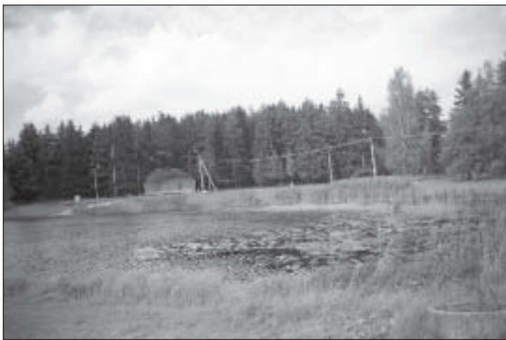
Parksepa järveäärne muruplats. Teostaja OÜ Subrik. Maksumus 71 460 krooni.