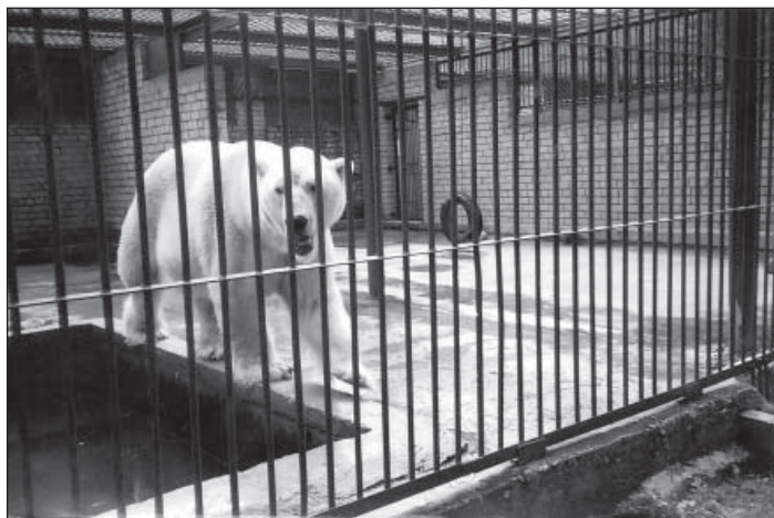
2007.a augustikuus toimunud Tallinna ekskursioonil saime tehtud vist viimase foto õnnelt hukkunud jääkarust, kelle nimi oli Franz.

Tule ise ja võta sõber kaasa! Koos on lõbusam.