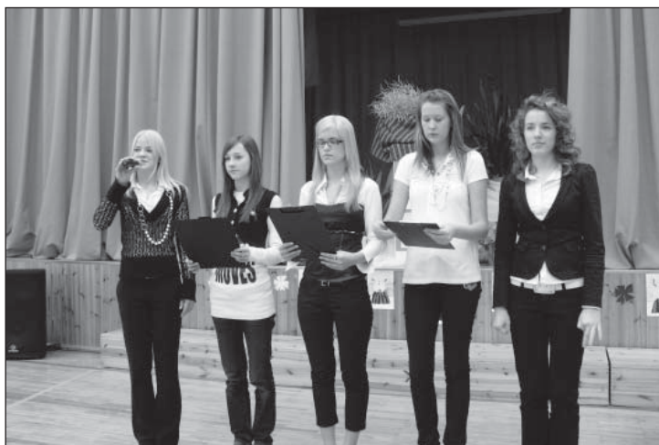
Esinevad Puiga kooli noored.

23. veebruaril täitus 134 aastat meie esimese presidendi Konstantin Pätsi sünnist (eluaastad 23.02.1874 – 18.01.1956).