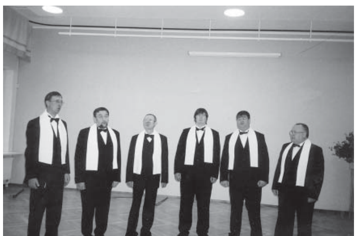
Õpetajate päeval laulavad Hauka Vägevad.

Jagatud rõõm on suurem, mure väiksem. Ootame oma seltsi veel rohkem ka Võru valla staažikaid õpetajaid!”