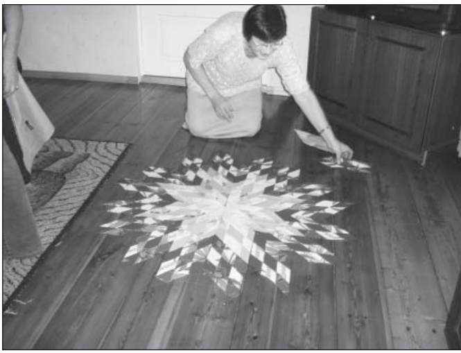
Virgad Puiga naised külastasid lapitehnika meistrit Aliis Allast. Fotol toimub lappidest mustri kokkupanek.