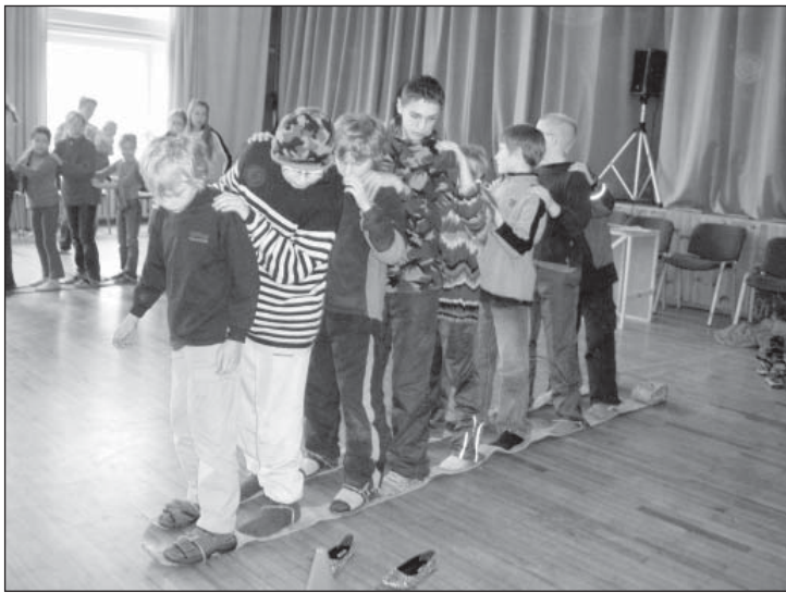
Lumeta suusavõistlused Puigal.