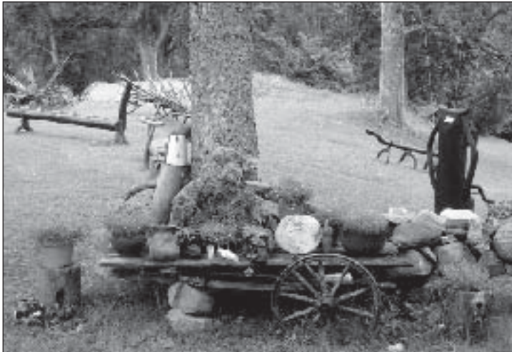
Nurgake Metsamoori põnevast perepargist.

saladuslikku ja õpetlikku. Metsamoori juures kohtub muinasjutt tegelikkusega, legend tänapäevaga. Saime elavat loodust meeltega tunnetada, õppisime ravimtaimedega ennast aitama, tegime psühholoogilisi meeiharjutusi, käisime loitsukeldris ja uudistasime Metsamoori varasalve.