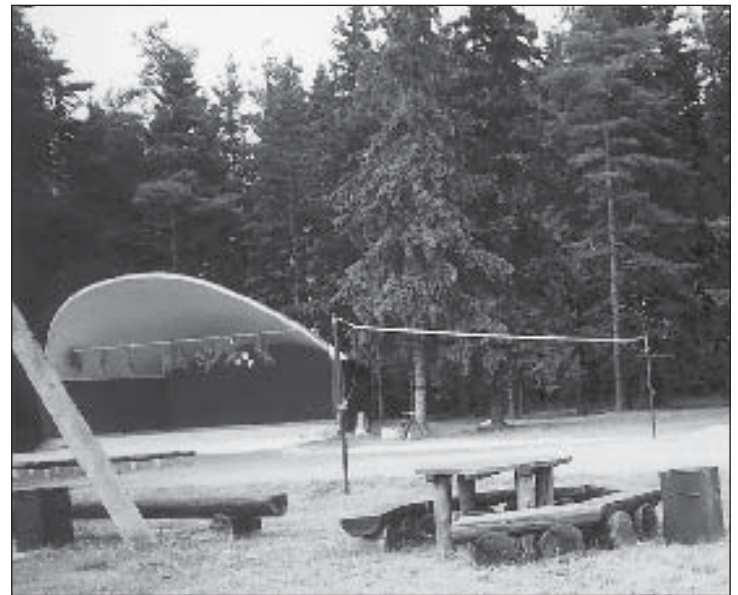
Remondi sai Parksepa laululava, täiendati puhkekohti pinkidega. Hind 129 181 krooni.