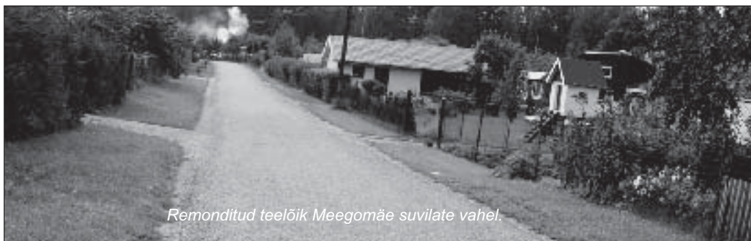
Remonditud teelõik Meegomäe suvilate vahel.