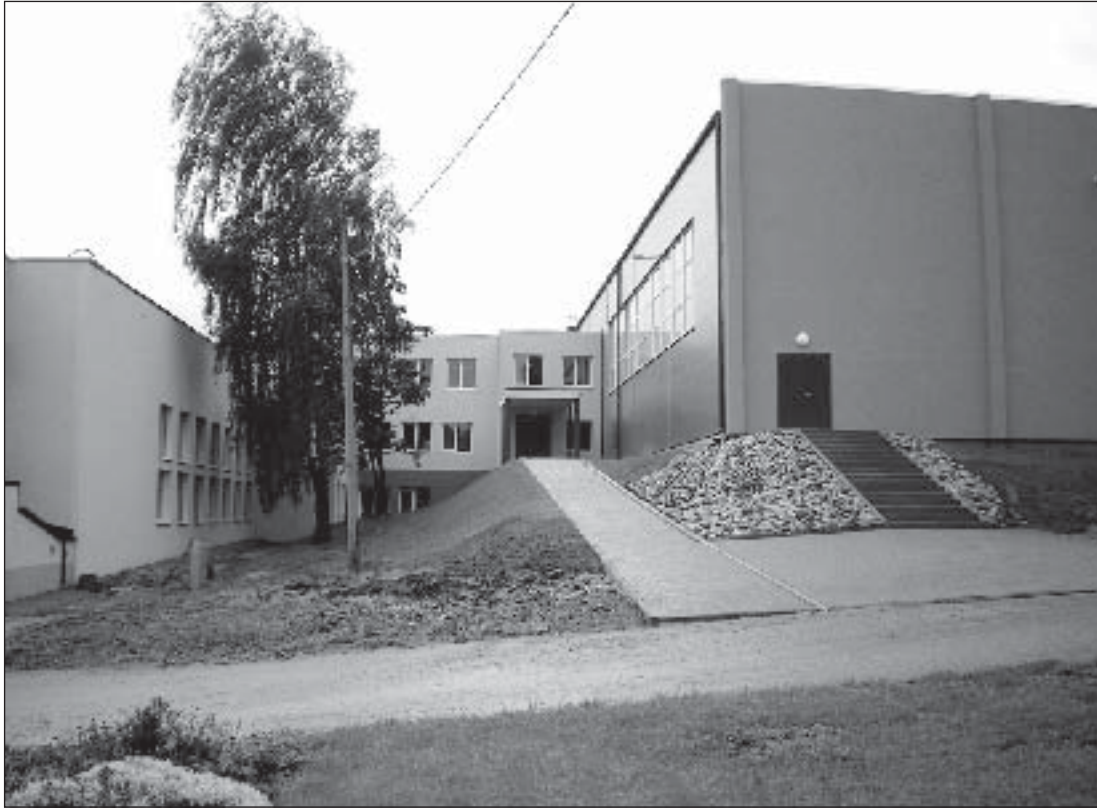
Puiga spordihoone pidulik avamine toimub praeguste plaanide järgi 3. oktoobril. Samas toimub kell 15 valla õpetajate päeva tähistamine.