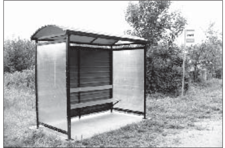
Uus bussipaviljon Mustjärvel. Samasugune paigaldati Meegomäele lahingukooli juurde. Maksumus kokku 73 166 krooni.