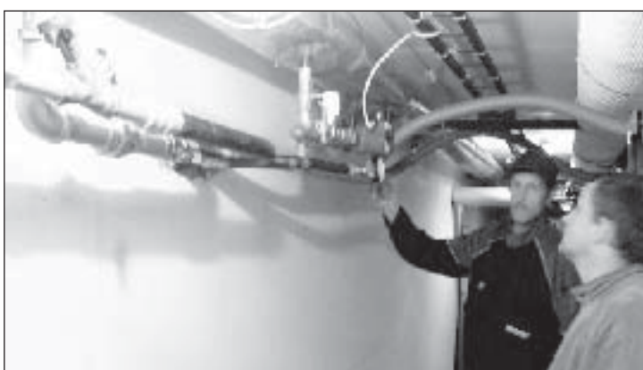
Väimela lasteaed ehitati välja põrandakütte reguleerimise seadmed (200 000 krooni).