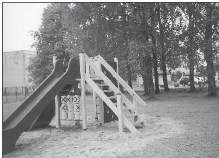
Parksepa aleviku laste vahva mänguväljak, mille maksumuseks (170 000 krooni) eraldati valla eelarvest 70 000 krooni ja kultuuriministeeriumi poolt 100 000 krooni.