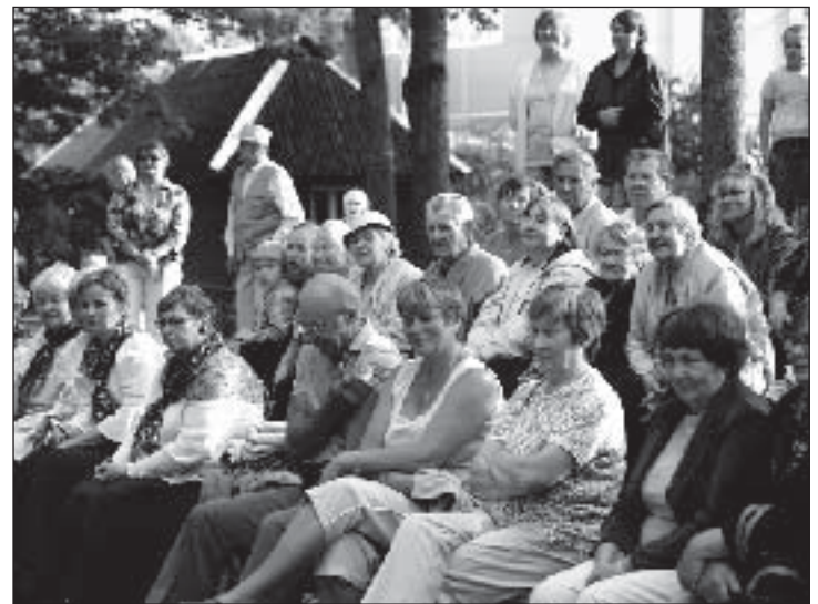
Publikut oli kohal rõõmustavalt palju.