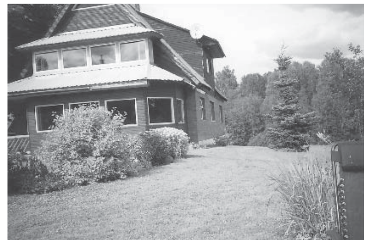
Perekond Parmasoni Kasvandu talu ilus elumaja.

Ka sel aastal sõidame Paun- vere väljanäitusele ehk Pala- muse laadale, mis sel aastal toi- mub 20. septembril. Vajalik on eelregistreerimine (telefonid eelmises infolõigus). Väljasõit toimub vallamaja juurest hom- mikul kell 8.