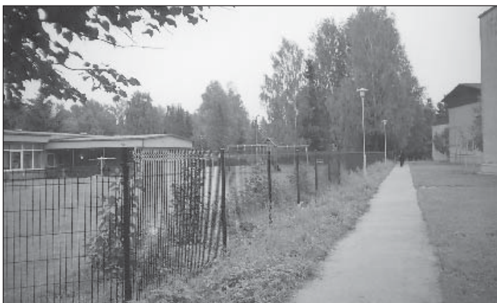
Parksepa lasteaed sai ca 400 m pikkuse moodulaia (maksumus 233 780 krooni).