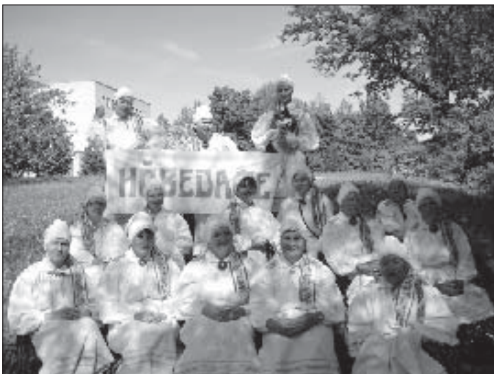
Hõbedased tantsijad (ehk Puiga baleriinid).

Tantsuring Hõbedane võttis osa kolmest suuremast üritusest nii maakonnas kui ka väljaspool: Võrumaa memme-taadi lustipidu Rõuge Ööbikuorus, Lõuna-Eesti memme-taadi rah-