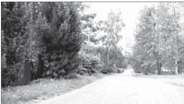
Meegomäe küla remonditud tee.