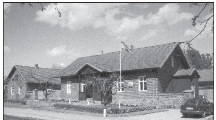
Eesti Maanteemuuseum endises Varbuse hobupostijaamas.

Maanteemuuseumi kenas söökla on paras teha lõunapeatus. Ulatuslikust ekspositsioonist