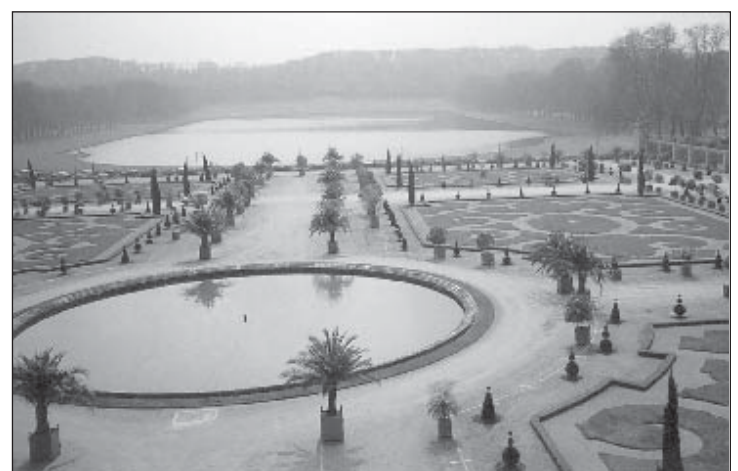
Vaade Versailles' lossi suurejoonelistele aedadele.