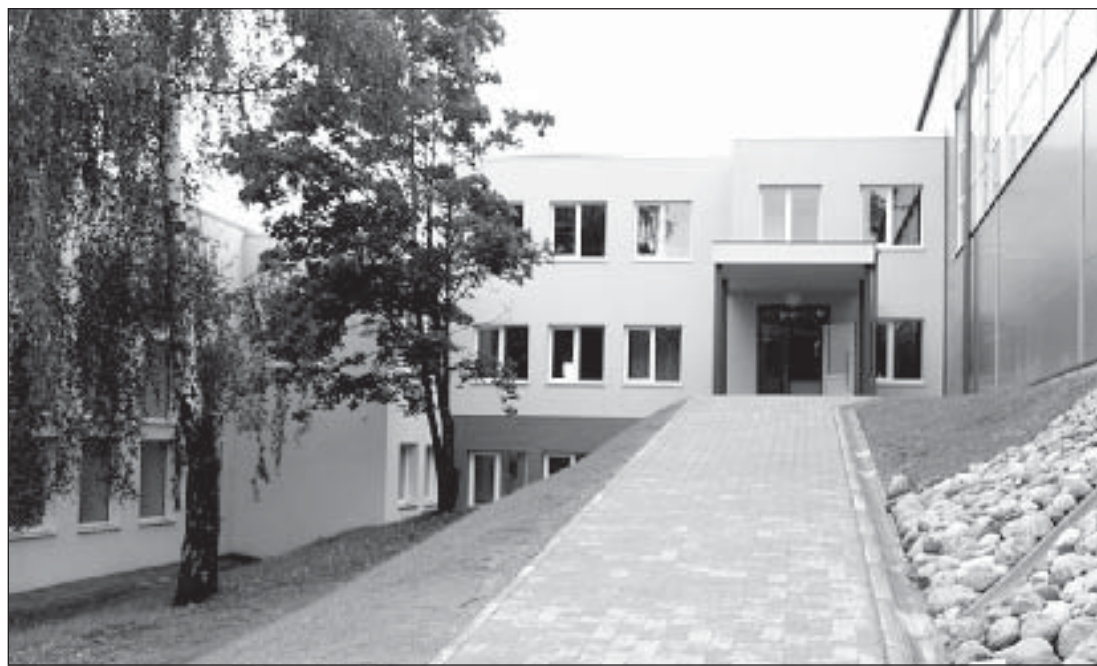
Peasissekäik Puiga kooli uude spordihoonesse.