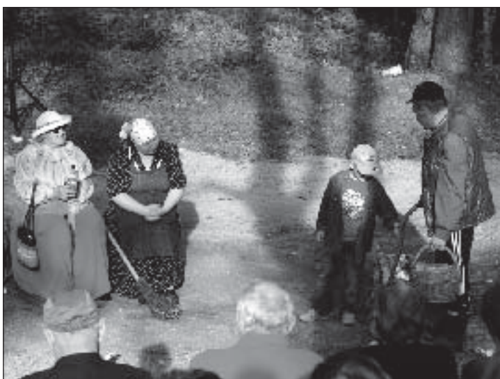
On ikka vahva, kui on oma küla näitering!

vapidu Põlva Intsikurmus ning Võru maakonna tantsupidu. Kõik need olid väga meeldejäävad ja toredad. Enamik tantsijaid said esimesed suuremad