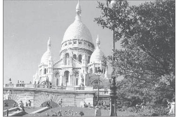
Sacrè-Coeur'i katedraal Montmartre'i mäel.

Versailles'i kompleksi, kuhu peale palee kuuluvad veel Tuileries' aed, Suur Kanal, Petit Trianon (Väike Trianon), Grand Trianon (Suur Trianon) jt, pee-