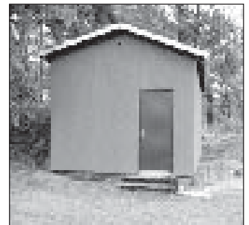
Toimub Väimela, Kose, Parksepa ja Puiga pumbajaamade puhastusseadmete rekonstrueerimine (filtrite, hüdrofooride, pumpade vahetus, pumbajaamade ümberehitamine kaheastmelisteks). Tööde maksumus 2 383 187 krooni. Fotol Puiga pumbajaam. Tööde lõpp septembrikuus