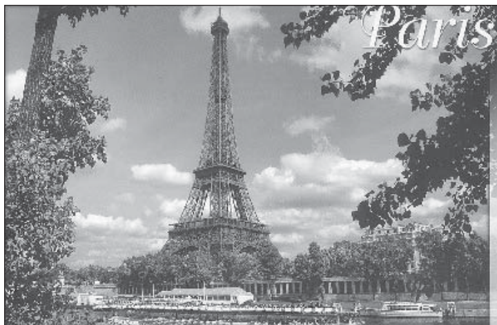
Eiffeli torn. Pariisi sümbol tänaseni.

väljakuks) ja asus ehitama. Töö kestis kaks aastat, kaks kuud ja viis päeva. Torn avati 31. märtsil 1889. aastal. Torni I rõdu asub 57, II rõdu 115 ja III 300 m kõrgusel. 1935. aastal paigaldati torni telemast, mis seda pikendas veel 21 m võrra. Eiffel ise elas tornis 276 m kõrgusel. Räägitakse, et ta olevat tornis vahel üles-alla käinud lifti kasutamata. Ehk elaski ta seetõttu 91aastaseks.