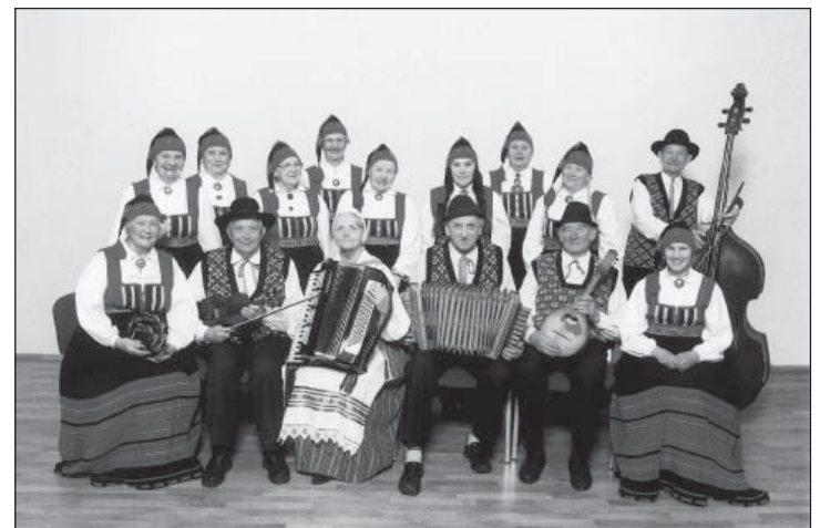
Seekord õnnestus Vannamuudul esimeseks tulla neljandat korda.