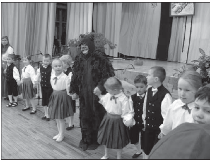
Folklooripäeva väga tähtis tegelane oli karu, kellelt head lapsed mett moka peale said!

XX folklooripäev algas Erja Aropi akordionihelide saatel. Traditsioonilise sabatantsuga liikusid osavõtjad saali ja see saba oli pikk: 200 osavõtjat! Rivis olid Võru loovuskool (M. Udras), Antsla gümnaasiumi kandleansambel (K. Kamberg), Parksepa keskkooli laste tantsurühm (H. Liloson), Parksepa laste kapell (E. Lumi), Võru I põhikooli tantsurühm Tsõõrike ja I kl tantsurühm (M. Pau), lasteaedade Päkapiikk (K. Mähar), ja Sõleke folkloorirühm (L. Sikk), Sõmerpalu põhikooli II kl tantsurühm (M. Rosenberg), Sõmerpalu lasteaia Lepatriinu folkloorirühm (T. Rõigas), Kreutzwaldi gümnaasiumi algklasside tantsurühm (K. Reiska), Lusti folk-