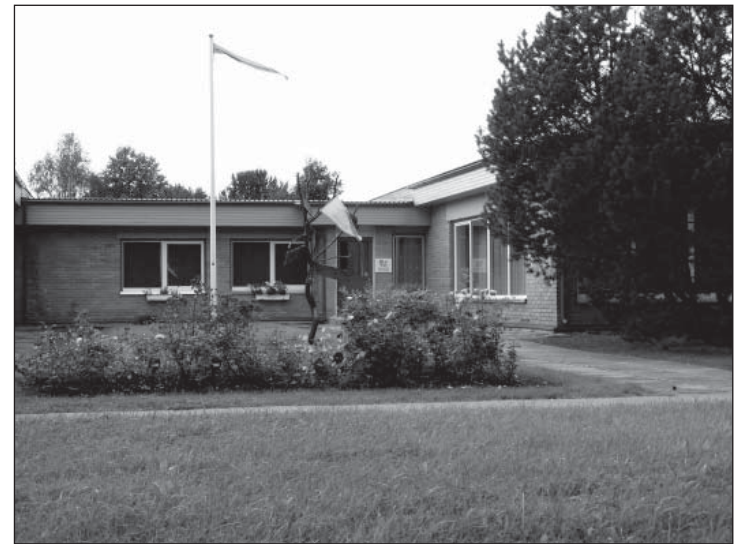
Järjest ilusamaks muutuv majaümbrus.

Meie õpetajatest on kuus pedagoogilise kõrghariduse-