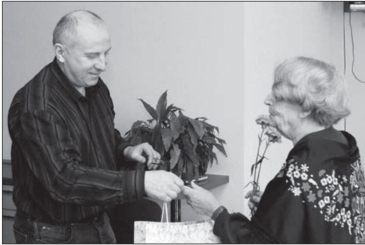
Hea lugeja ehk mäletab, et eelmine valla leht kandis juubelinumbrit 70. Sel puhul (12. märtsil) paluti vallamaja kõik need, kes 12 aasta jooksul on oma kaastöödega aidanud lehte sisukamaks muuta. Anti üle tänukirjad ja meened ning peeti tulevikuplaane. Fotol ütleb vallavanem aitäh toimetajale.