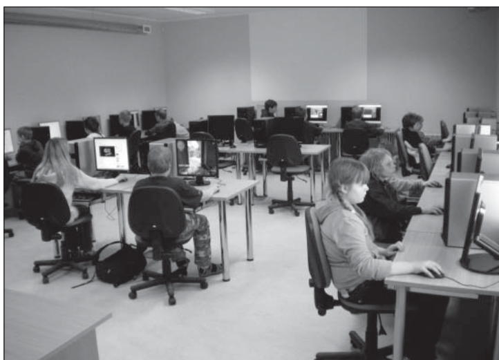
Puiga põhikooli arvutiklass. Kohti tervelt 23.