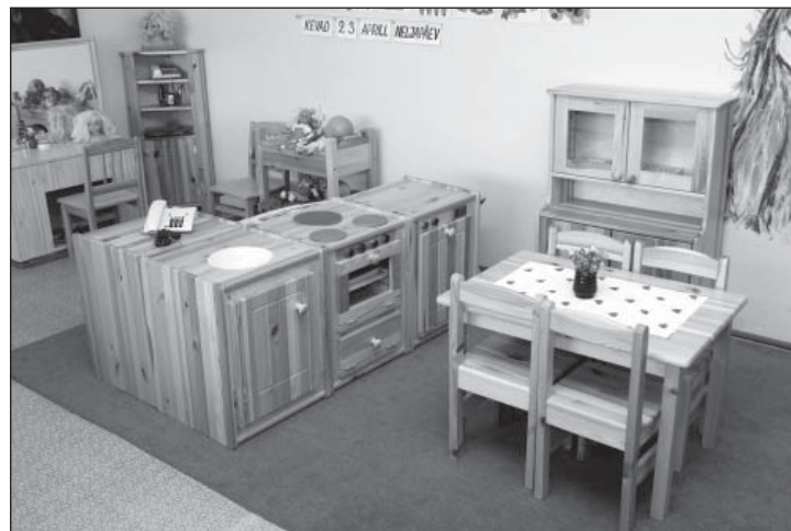
Nurk õppimiseks ja mängimiseks.

Tunneme vallapoolset toetust ja üldse on koostöö olnud meeldiv. Aitäh ütlevad vallavalitsusele ka meie loodus- ja õuesõppe sümbolid Pokud!”