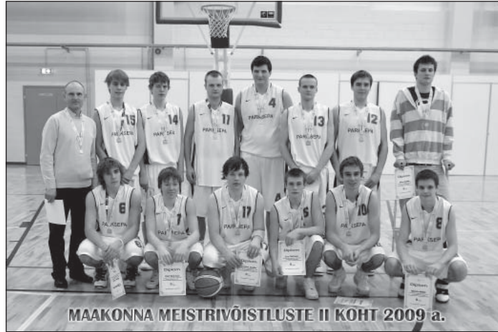
Mängu tulemus Antsla vald - Parksepa oli 69 : 67. Väga napp allajäämine oli tingitud paljus ebaõnnest löpuminutitel. Mäng toimus 11. aprillil.

Võru valla projekti maht on 86 250 eurot. Projekti abil hangitakse spordiinventari ning spordisaali sisustust, toimuvad erinevatele alagruppidele (õpilased, täiskasvanud, veteranid, puuetega inimesed) korvpallivõistlused, koolitust saavad korvpallitreenerid ning toimuvad õpilaslaagrid. Programmi