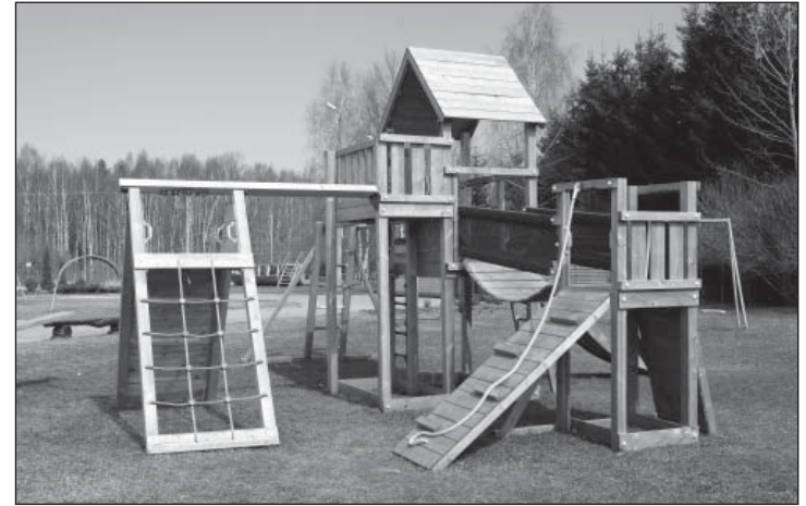
Uus mänguväljak või isegi lausa linnak!

Sobitusrühm sai oma ruumi koos uue sisustusega, võimlemissaali on laiendatud ja juurde tehtud vahendite paigutamise