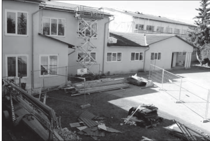
Parksepa kooli renoveerimine on veel täies hoos.

E-koolile on täielikult üle läinud Puiga kool. Parksepal on see toimunud osaliselt. Mõlemas koolis on head tingimused hu-