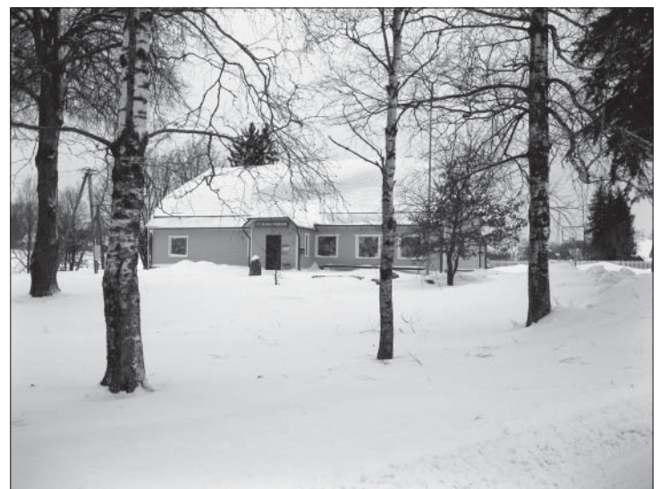
Maapoed kipuvad hingusele minema. Aga Navi pood püsib!

koolis ei õpetata, nii et peame nad ise välja koolitama. Oleme uusi seadmeid juurde soetanud (robot, kaks valumasinat, vaakumtõmbemasin). Ehk tuleb 2011. aasta juba parem.”