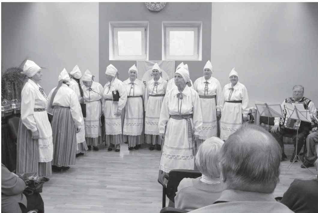
Kontsert, mis tähistas möödunud ühtteistkümmet lauluaastat.

- Ühislaulmisest 20. augustil võeti osa Kunglas (Tagaküla LMS).