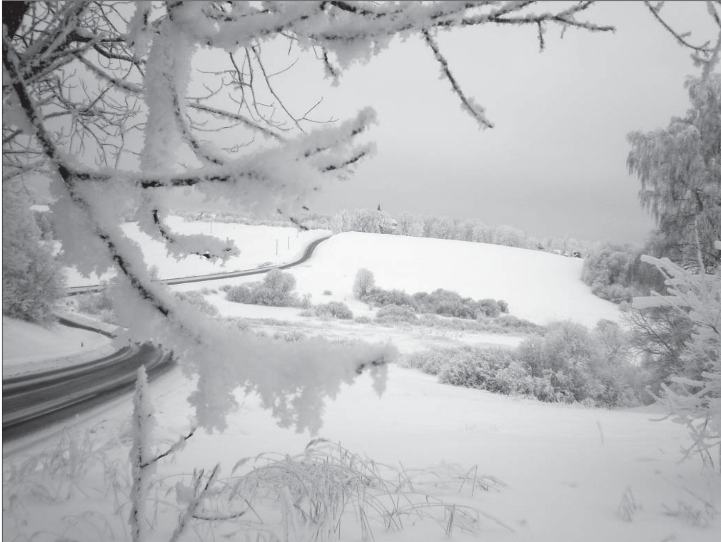
Talv algab 22. detsembril kell 1.38.