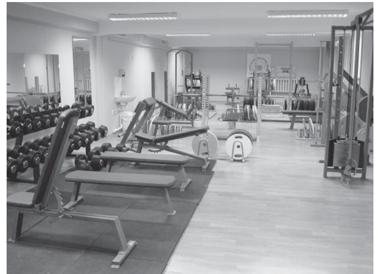
Ülimoodne jõusaal, mille omanikuks sai Parksepa keskkool tänu koostööle raskejõustikuklubiga Strongman. Jõusaali vahendite muretsemisele pani öla alla ka Võru vallavalitsus.

Koostöös raskejõustikuklubiga Strongman sai Parksepa keskkool igati nüüdisaegse jõusaali, kus praegu rassivad sõbralikult üheskoos nii päris jõumehed kui koolipoisid. Ja eriti tore on see, et suured mehed on leidnud aega neid õigeid treeninguvõtteid poistele õpetada. Nii et hoidke alt, praegused tipprammumehed!