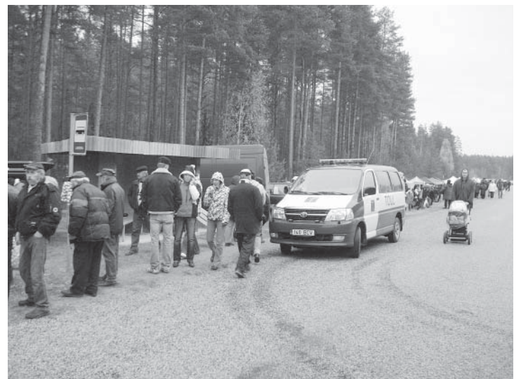
Populaarsed on laatadel käigud. Fotol on rahvas sellesügisel Linde laadal.

Detsember - jõulupeod eakatele Puigal ja Parksepal.