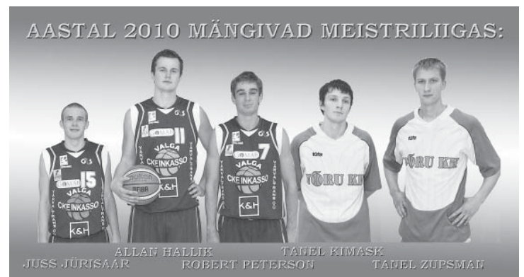
Need noormehed on kõrgliiga taseme vääriliseks kasvatatud Parksepa spordiklubi.

Parksepa rahvamaja isetegevuslaste ringide õhtu toimub 14. jaanuaril 2011 algusega kell 19, ikka koolimaja saalis. Juhataja Hugo palub kõigil ringidel ette valmistada kolm ilusat pala ja ühtlasi mõned head soovid rahvamaja 55-ndaks sünnipäevaks. See toimub sügisel.