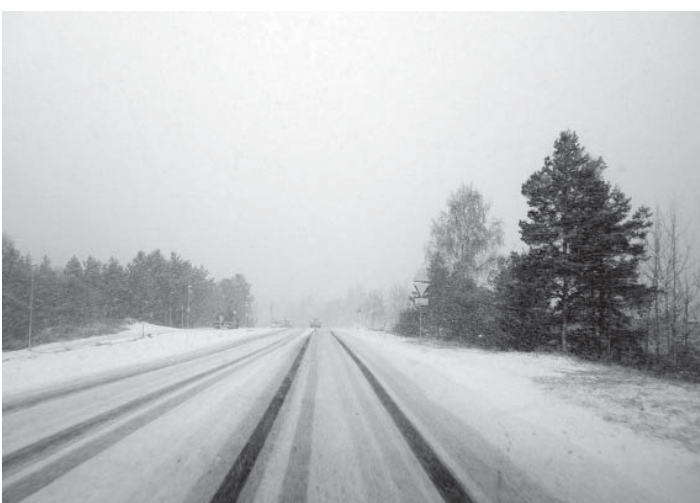
Esimene lumi 15. novembril 2010.