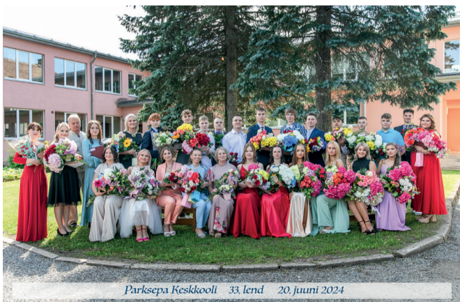
Parksepa Keskkooli gümnaasiumiastme 33. lennuna said lõputunnistused 28 õpilast.