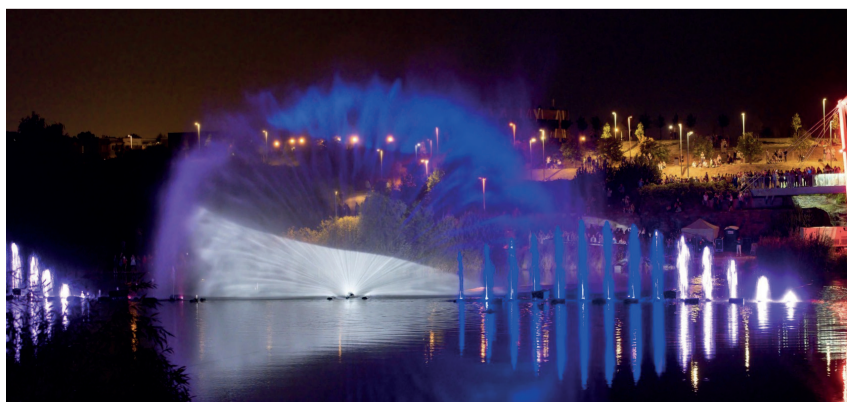
Festivalil näeb ainulaadset visuaali.

Võru valla kultuuri- ja noorsootöökeskus