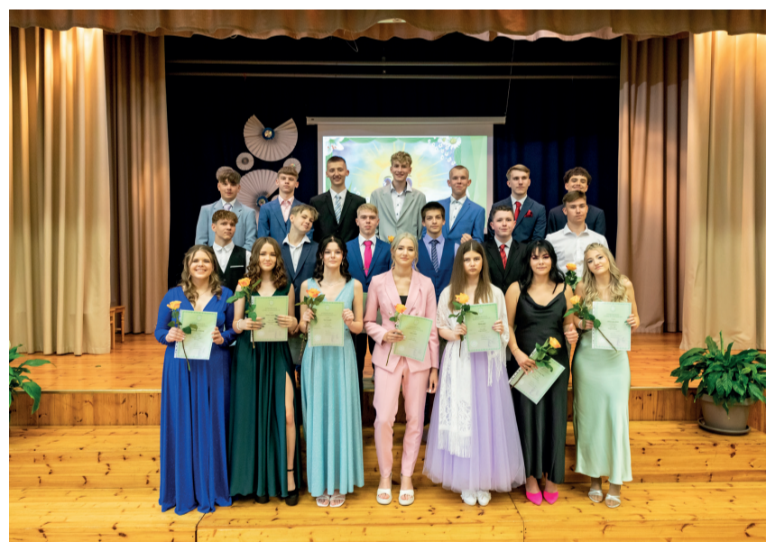
Puiga Põhikoolis oli sel aastal lõpetajateks 20 noort.