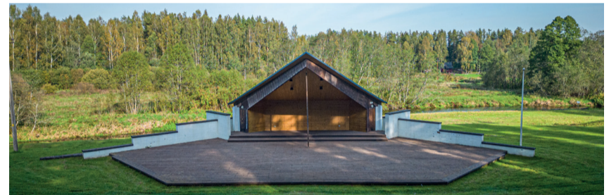
Harjumäe laululava Võru vallas.

Katariina Ummelk avalike suhete spetsialist