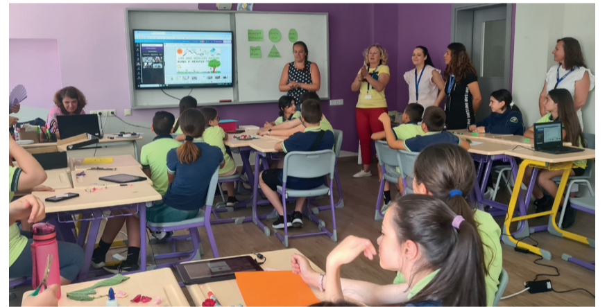
Viie erineva riigi õpetajad said ainulaadse kogemuse rühmatööna läbi viia õppetunni bulgaaria õpilastele STEAM-õpet rakendades.