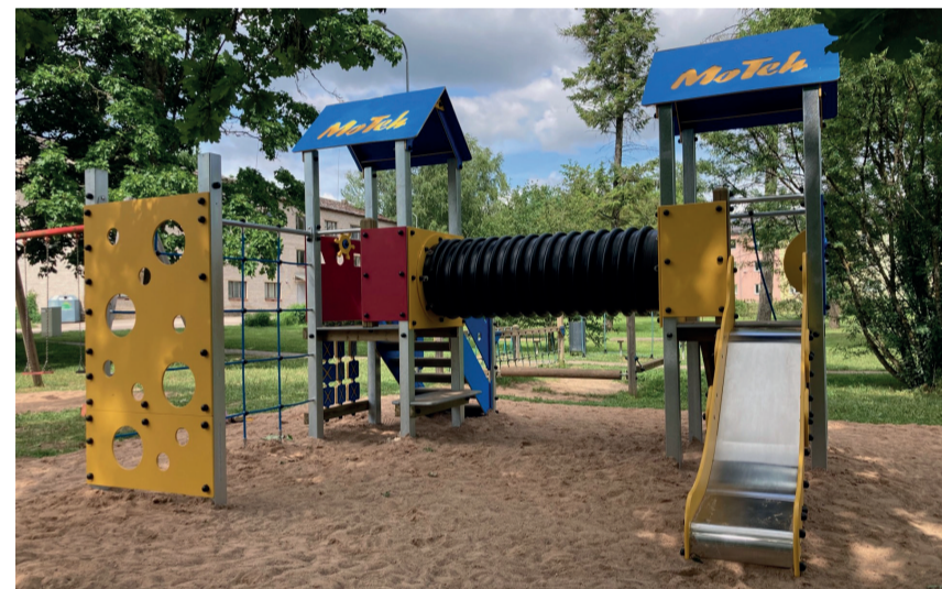
Väimela mänguväljaku uus atraktsioon.

Katariina Ummelk avalike suhete spetsialist