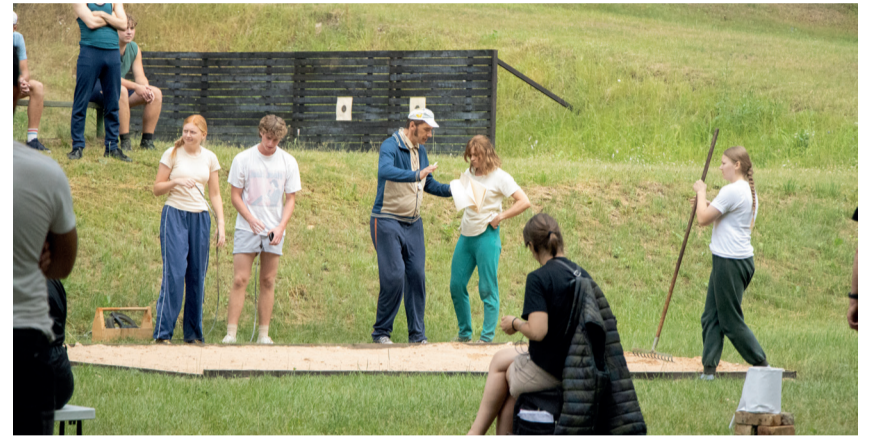
Näitlejad filmivõtetel Kubijal.

Katariina Ummelk avalike suhete spetsialist