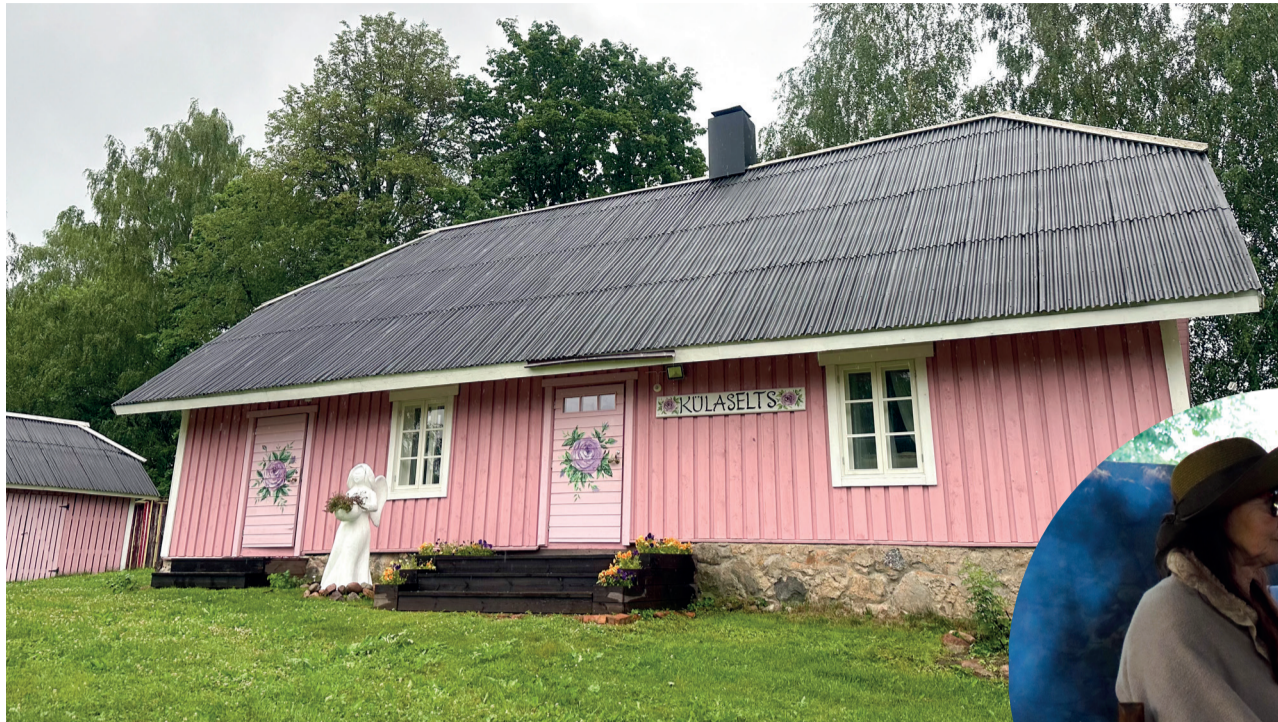
Kündja külaseltsi maja on seltsi liikmete nägu.