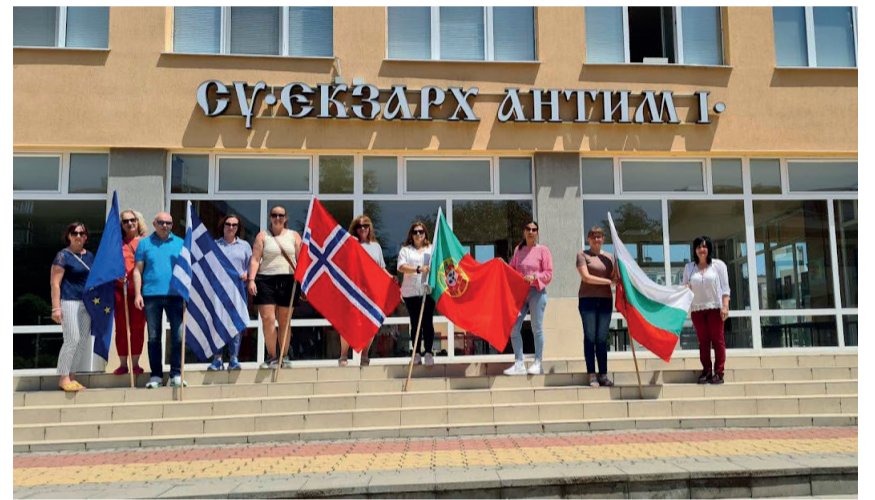
Erasmus+ esimene projektikohtumine toimus Exarch Antim I Keskkoolis Kazanalkis, Bulgaarias.