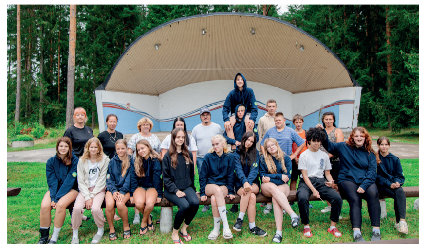
Võru valla päevane õpilasmalev.