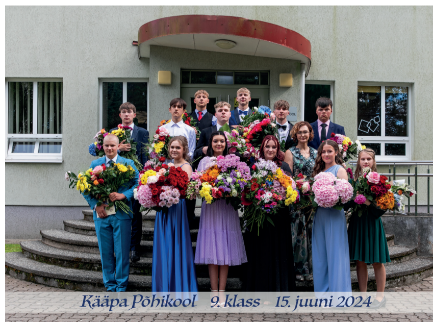
Kääpa Põhikoolis lõpetas tänavu 13 õppurit.