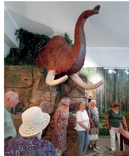
Reisilised Valga muuseumis.

Helga Ilves Tsolgo ansambli Pihlapuu juhendaja