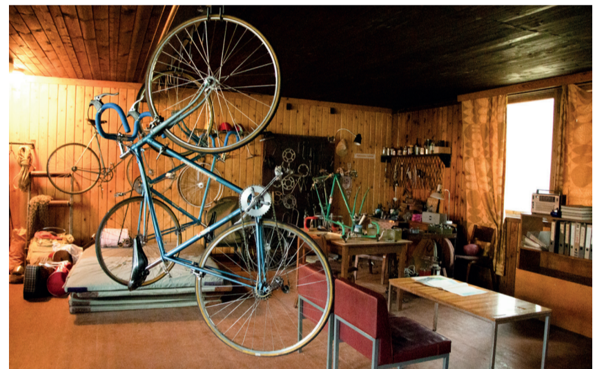
"Elva spordiklubi", mis tegelikult on üles seatud Kubijal.