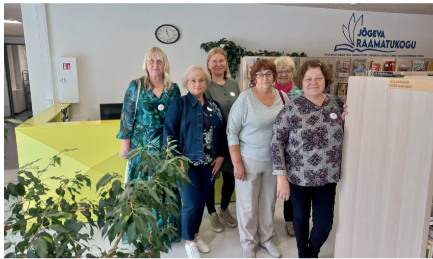
Võru maakonna raamatukoguhoidjad Jõgeva Linnaraamatukogus.