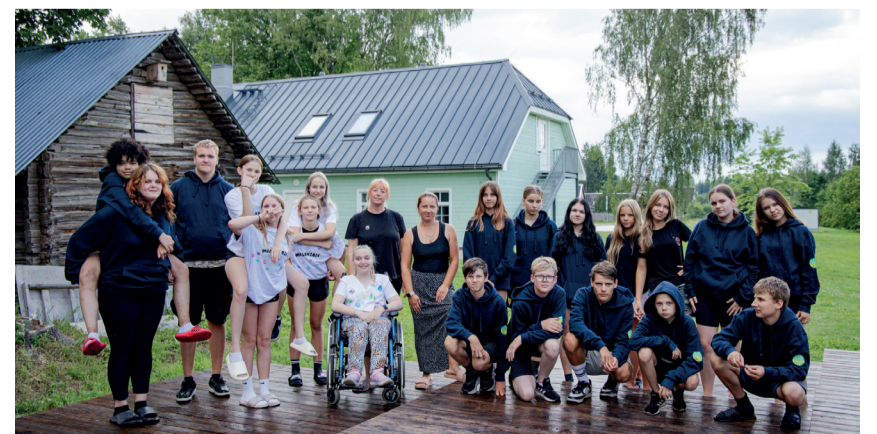
Võru valla ööbimisega õpilasmalev.