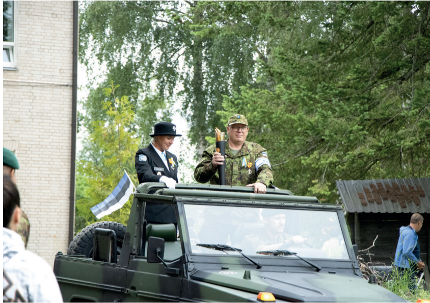
Võidutule saabumine Võru maakonda.

kes on oma vabast tahtest valmis kaitsma Eesti riigi vabadust, nii nagu seda teevad kaitseliitlased ja teised toetavad organisatsioonid. Hea näitena on siinsamas Sulbi külas Sulbi Maarahva Seltsi inimeste koostatud kriisiplaan ja moodustatud kriisigrupp. Kogukonna panus riigikaitsele on meile oluline,” selgitas vallavanem iga inimese enda panuse olulisust.