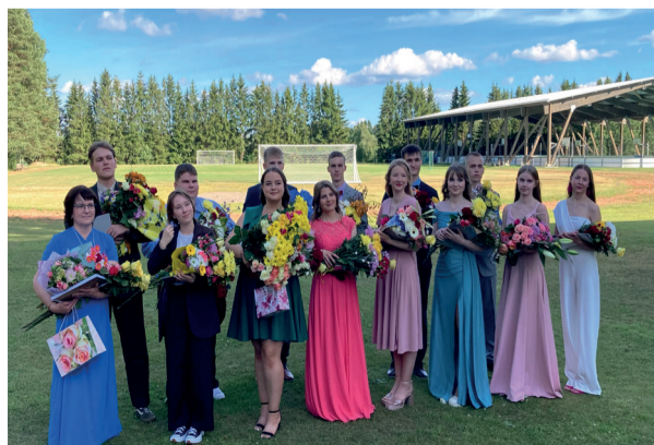
Vastseliina Gümnaasiumi 12. klassi lõpetajaid oli võrreldes eelmise aastaga üle poole rohkem - 13.