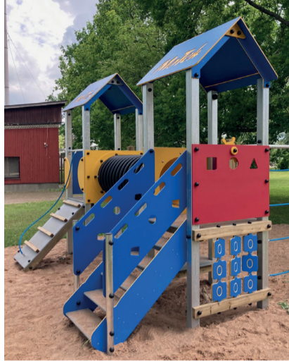
Mängima minnes vaata, kas leiad selle üles.

Toid teostas MoTEh OÜ, kes lisas mõlemale ronilale ka toreda atraktsiooni asukoha nimetuse.