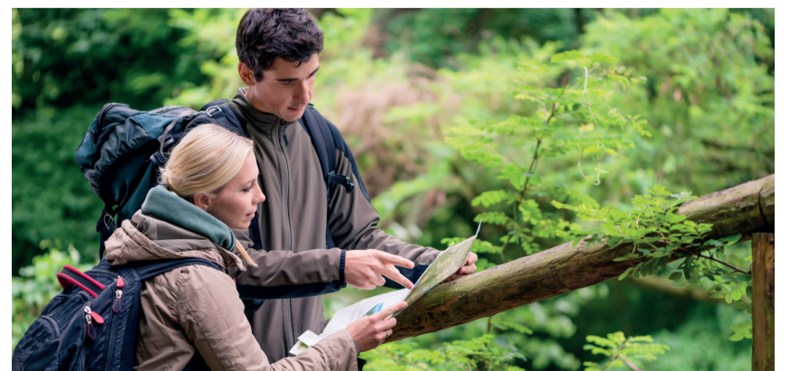
Pilt on illustreeriv.