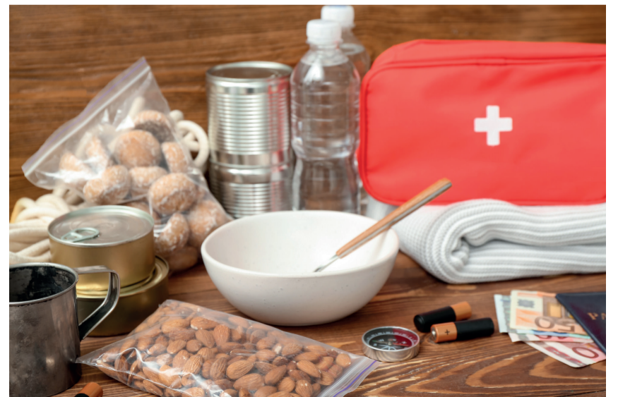
Pilt on illustreeriv.