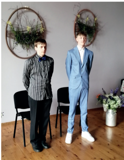
Orava Koolis lõpetas 2 noormeest.

Katariina Ummelk avalike suhete spetsialist 5309 9116