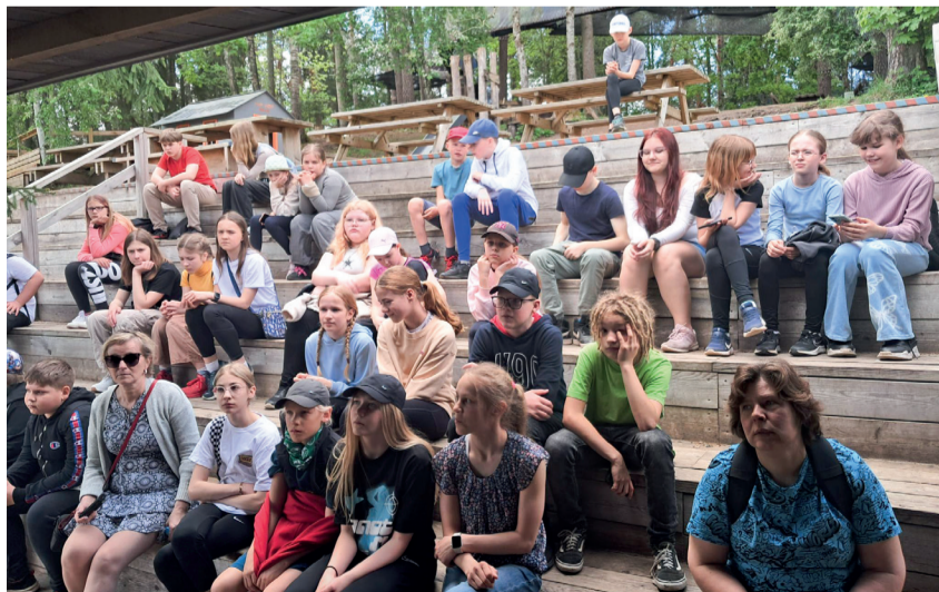
Valla koolide teise kooliastme õpilaste preemiareis.

Lõunasöök oli võrgupargis ning seejärel sõitsime Rakši kaameliparki. Pargis elavad erinevad loomad: kaamelid, alpaka, laamad, kitsed, eeslid, mägiveised, lambad. Loomi sai lisaks vaatamisele