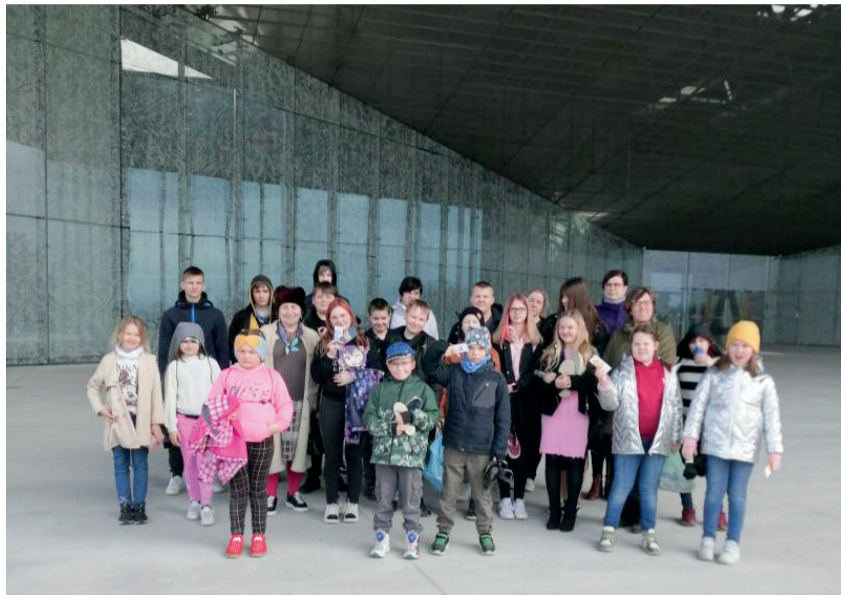
Orava koolipere ERM-is, kus tutvuti näitusega "Uurali kaja" ning seejärel osaleti õppeprogrammis "Kuidas päike lauale saada".