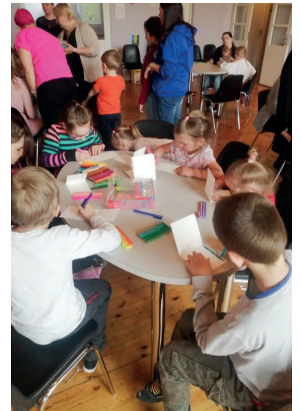
Perepäeval meisterdati ühiselt.