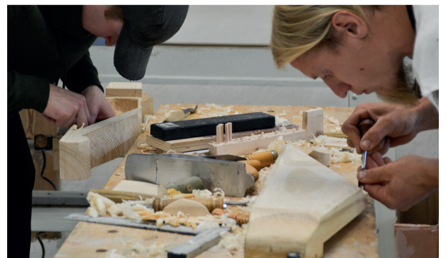
Kandele valmistamine.