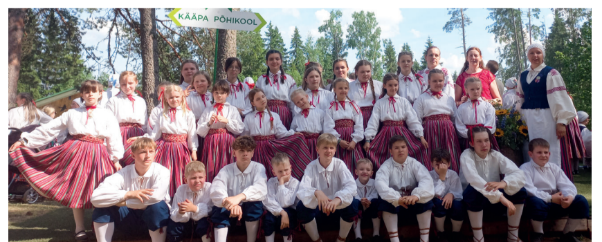
Kääpa kooli rahvatantsijad Kagu-Eesti tantsupeol.