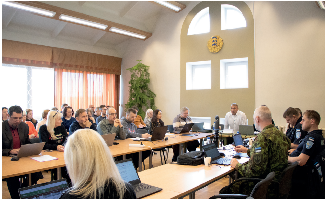
7. mail toimus vallamajas valla ja linna ühine õppus „Wõrosanna segadus”.

Juhansoo sõnul ilmnisid eelmisel aastal toimunud õppusel mitmed puudused. „Oleme need kaardistanud, koostanud uue valla ja linna ühendstaabi juhtimisstruktuuri ja juhendid ning soovime neid nüüd testida,” selgitab Juhansoo.