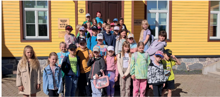
Valla koolide esimese kooliastme õpilaste preemiareis.

1,5 tundi möödusid lennukiirusel ja juba vahetasid grupid oma