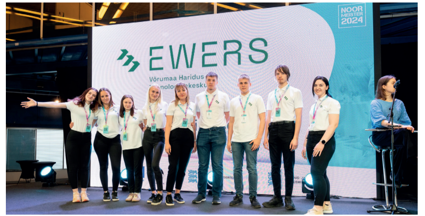
EWERSi õpilased oskuste festivalil „Noor Meister“ avapeol.

Agnes Catrén Pähna Võrumaa Haridus- ja Tehnoloogiakeskus