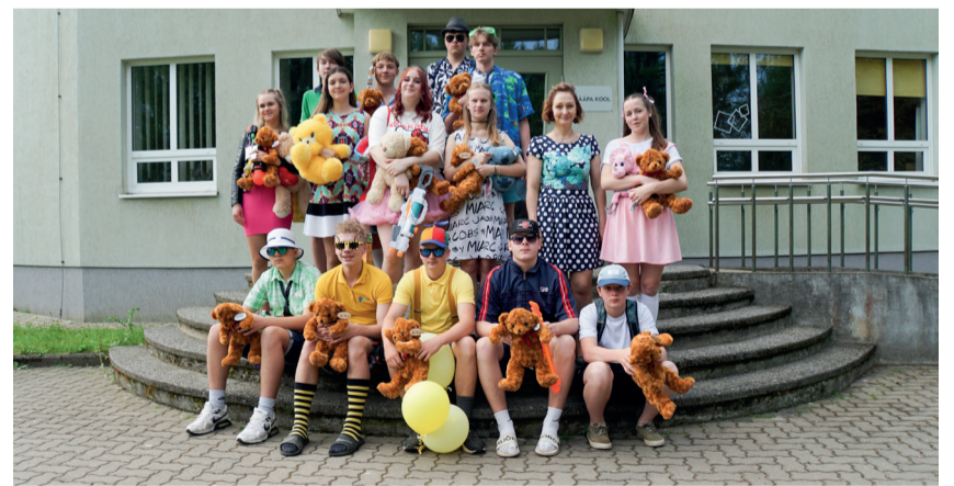
9. klassi tutipäev, mil istutati kooli õuele ka iluõunapuu.