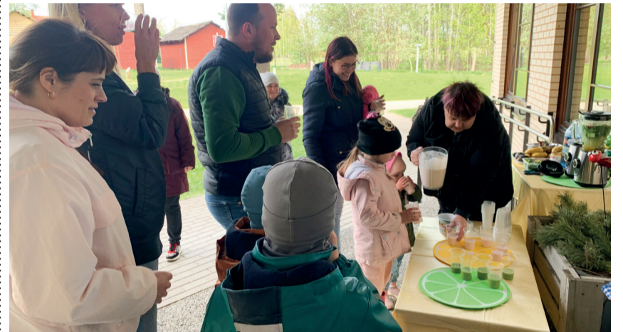
Osalejad said maitsta erinevaid smuutisid ja tutvuda koostisosadega.