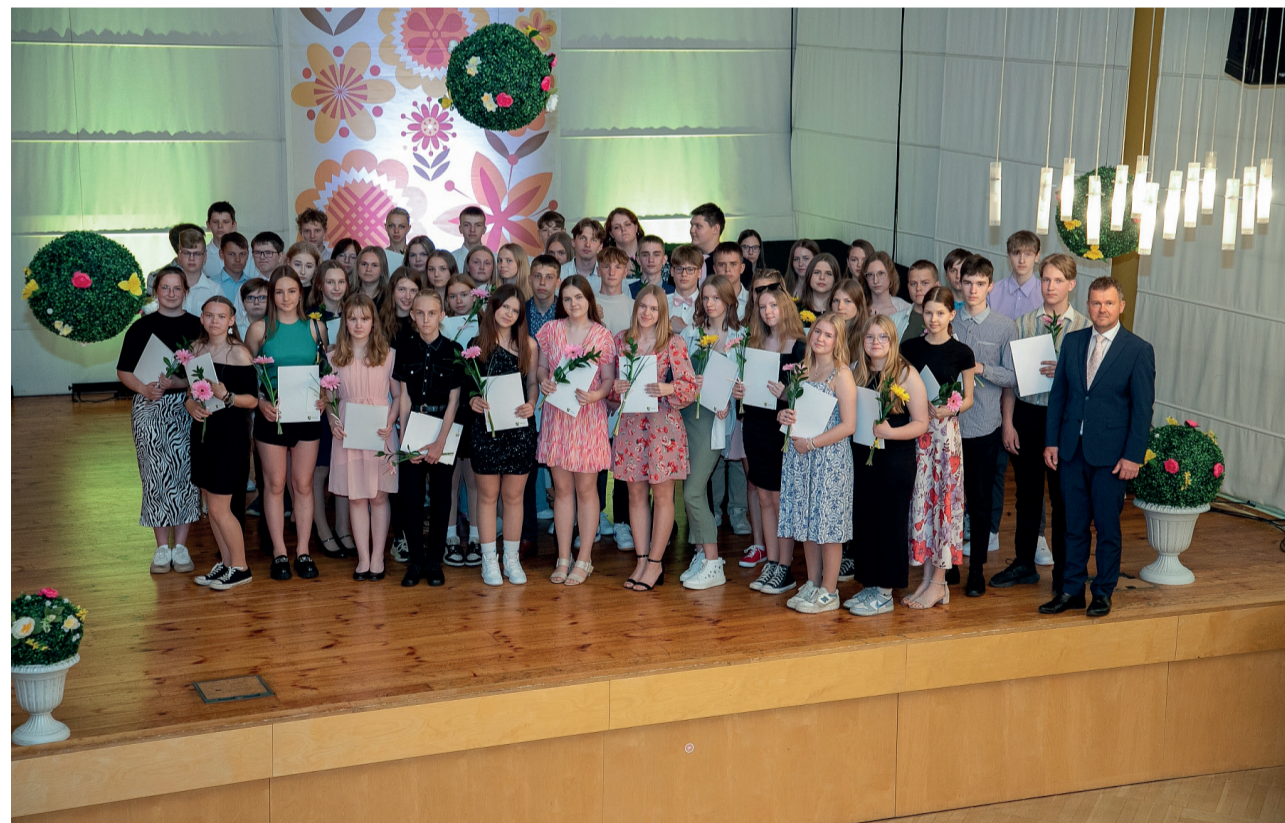
Võru valla koolide III kooliastme ja gümnaasiumi parimad õpilased.

Suurepärase tulemustega Võru valla koolide III kooliastme ja gümnaasiumiõpilased olid 29. mail kutsutud Võru kultuurimaja Kannel tänuüritusele.