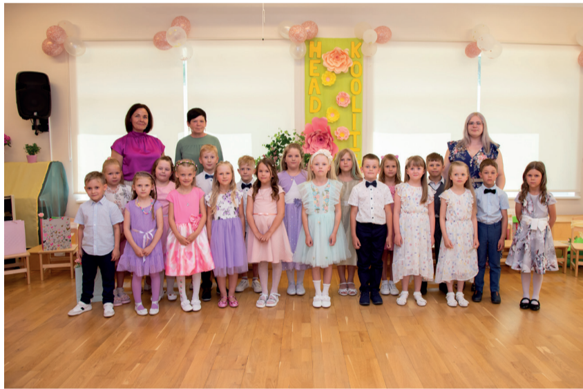
Puiga lasteaias Siilike 19 last, kes sügisel kooliteed alustavad.