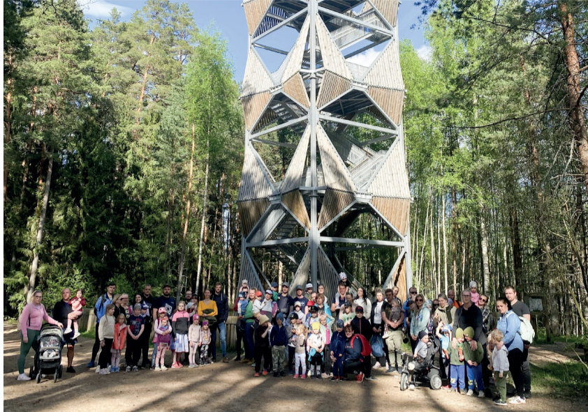
Suuremad ja väiksemad matkajad Valgesoos.