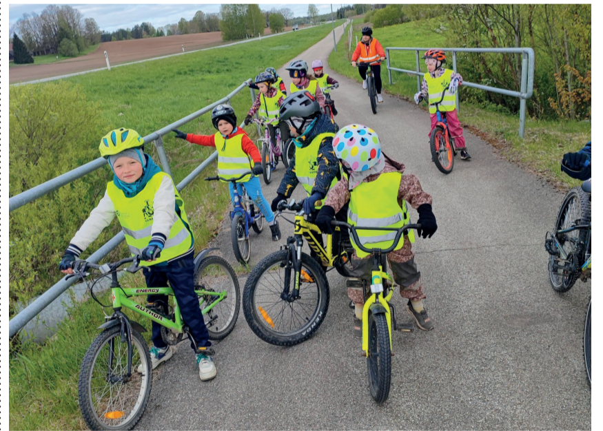
Lillehaldja rühma lapsed said oma rattasõidu oskusi proovile panna Lasva kergliiklusteel.