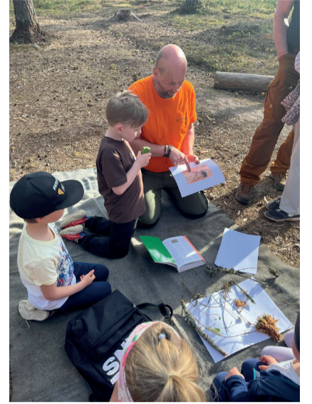
Hoolekogu liige tutvustas soos kasvavaid taimi.