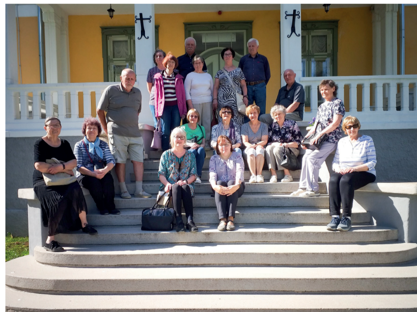
Reisilised Luua mõisa trepil.

Külli Ossul Sõmerpalu haruraamatukoguhoidja