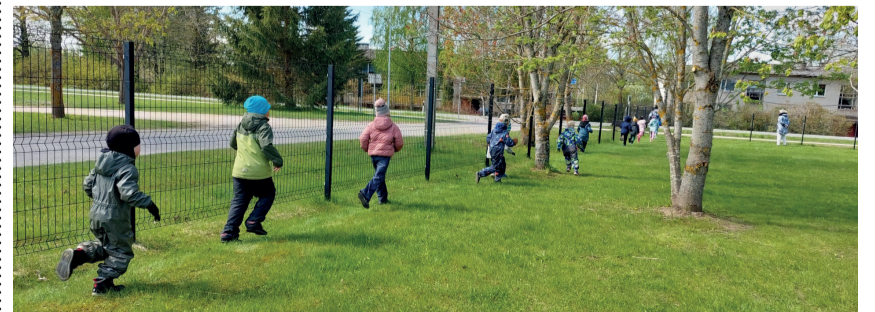
Lasva lasteaia traditsiooniline aiajooks.