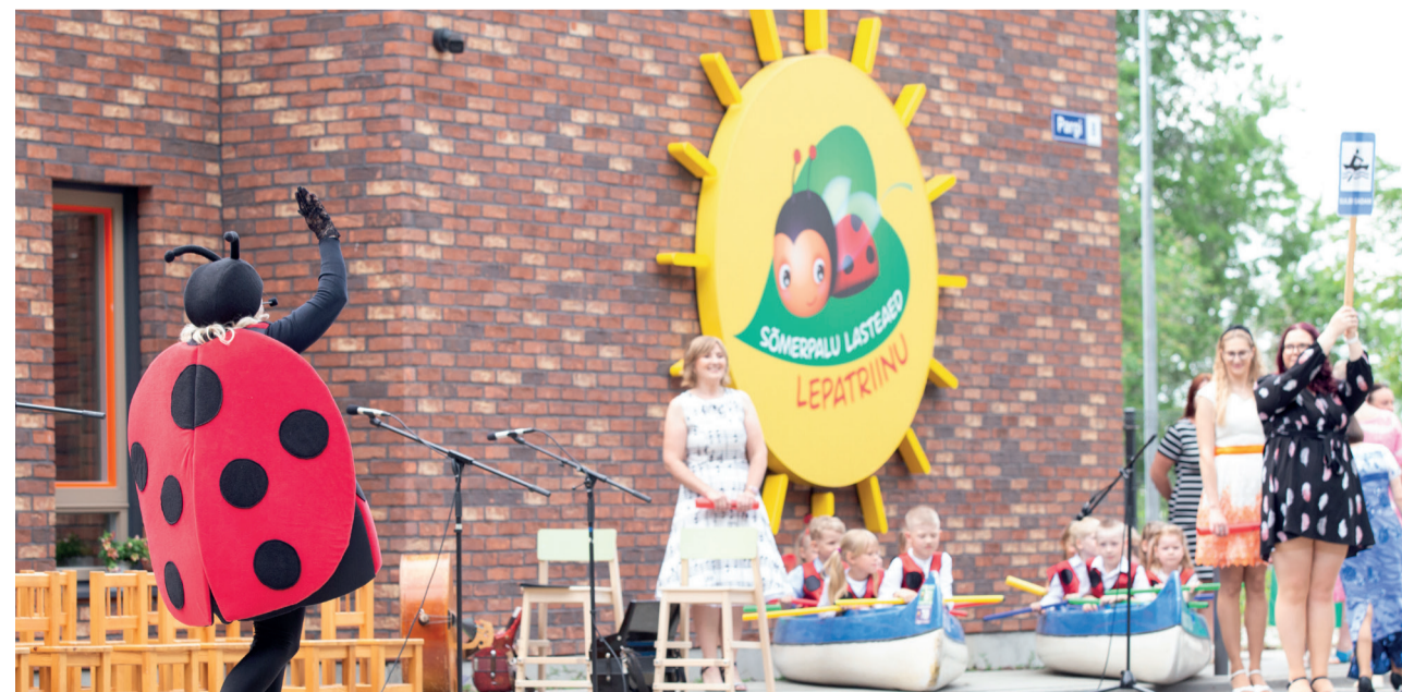
Sõmerpalu lasteaia Lepatriinud startisid avapäevase ürituse alguses Sulbi sadamast, et uues majas end sisse seada.