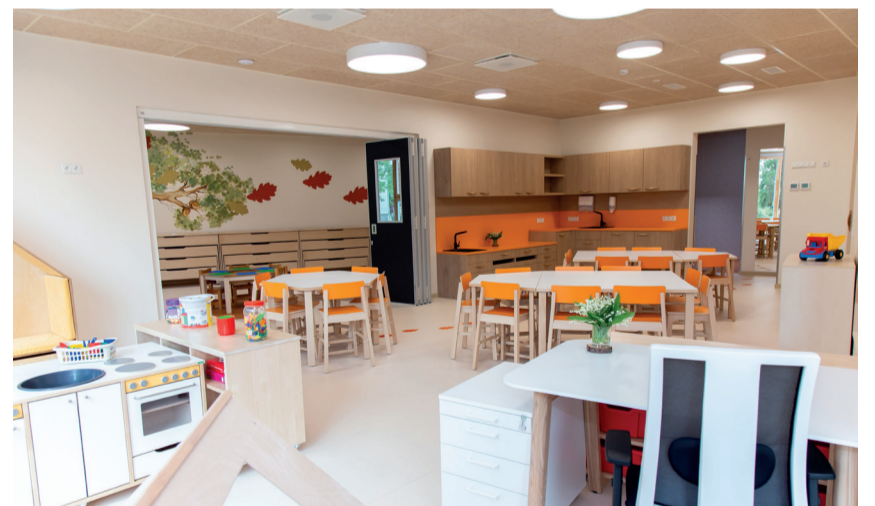
Uues lasteaiahoones on igal rühmal eraldi sissepääsuga mängutuba ja magamistuba. Mängutoas on ka kööginurk, mille üks tasapinna osa on laste jaoks madalamaks tehtud.

Uue lasteaiahoone avamise puhul olid lasteaiaopere õnnitlema tulnud ka Võru linna ja Antsla valla esindajad, endine Võru vallavolikogu esimees, Tallinna Ülikooli Haridusteaduste instituudi esindaja, Võru Instituudi esindaja, AS Toftan esindaja, Võru valla lasteaegade juhid, Osula Põhikooli esindajad, laululapsed ja bänd, Võru valla koolide juhid, lasteaia hoolekogu esindaja ja ümberkaudsed