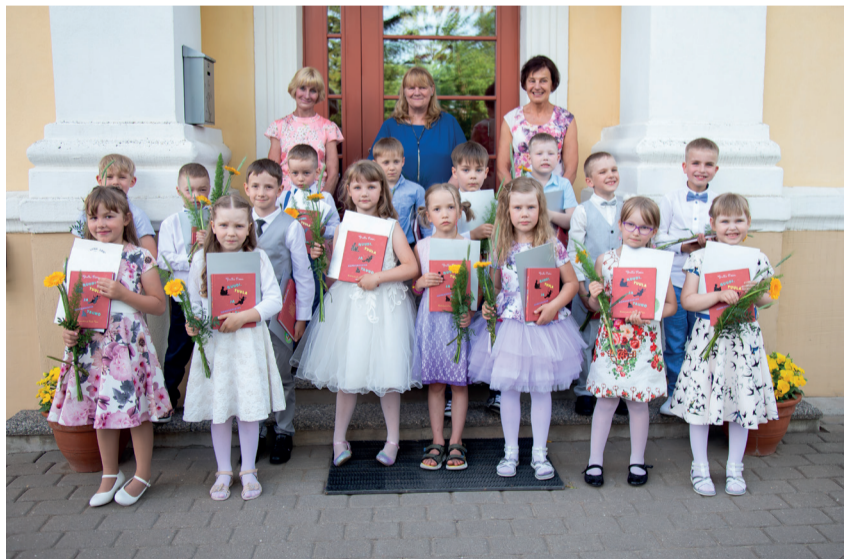
Vastseliina lasteaias lapsed, kes sügisel kooliteed alustavad.