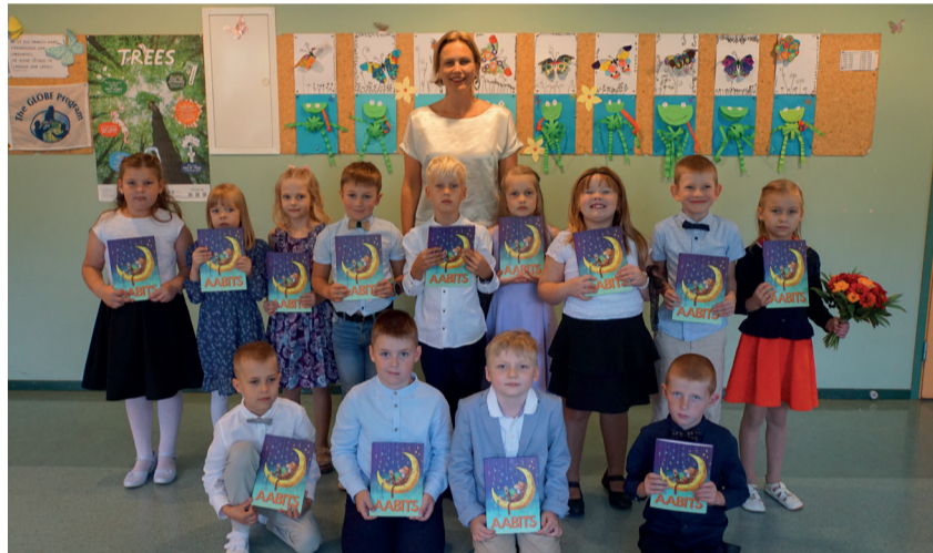
Kääpa koolis ulatati aabitsad viieteistkümnele õpilasele.

Katariina Ummelk avalike suhete spetsialist