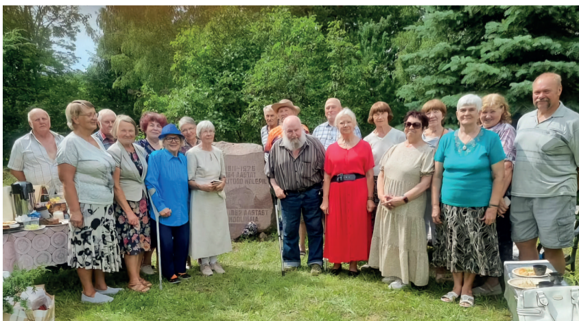
Tänavusel Kolepi kooli kokkutulekul osalejad.