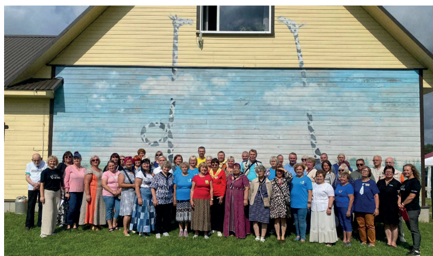
Aruteluringis osalejad Navi seltsimaja juures.