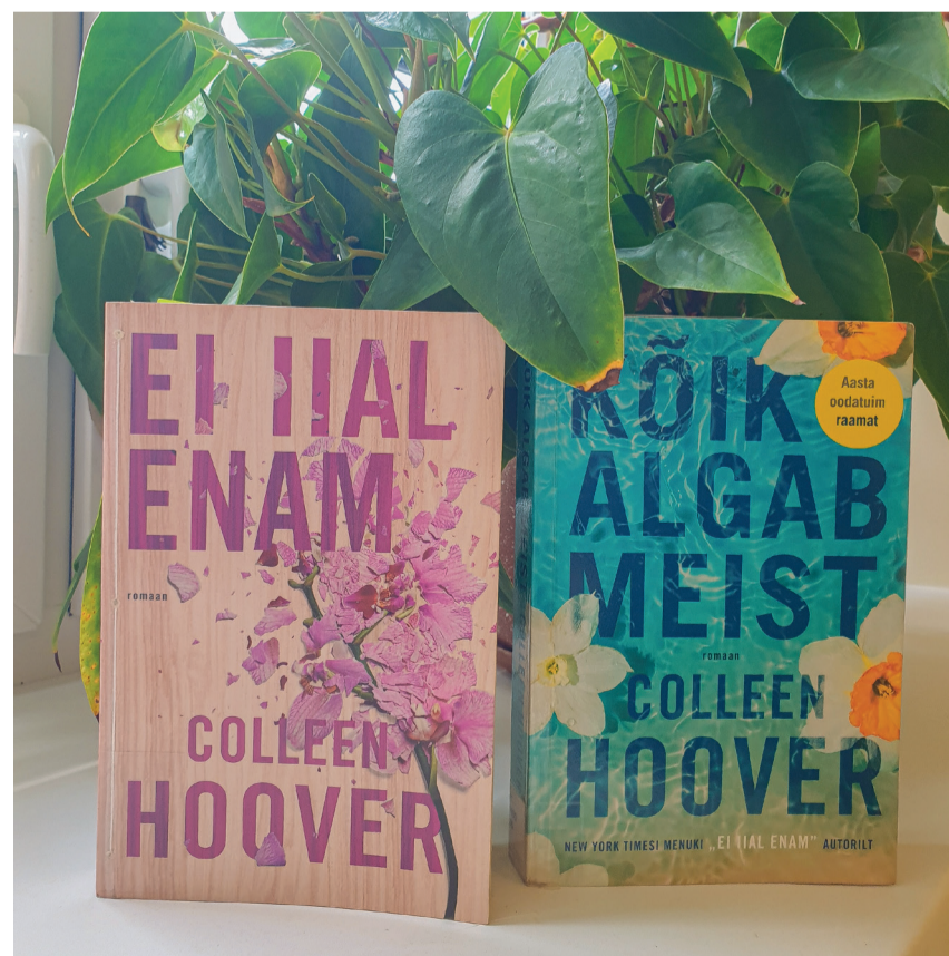
Kaks populaarset raamatut lugejate seas.