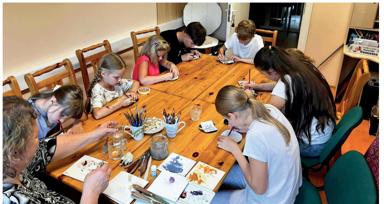
Tänavuse Võru valla laste huvilaagri tegevused olid väga mitmekesised.