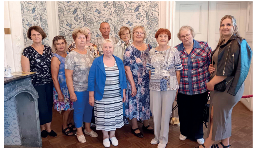
Orava haruraamatukogu lugejad Alatskivi lossis.