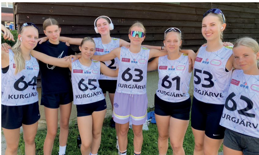
Korvpallitüdrukud Kurgjärve jooksul.