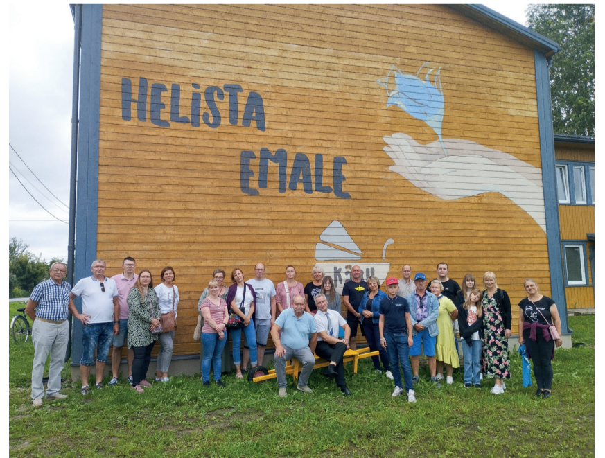
Viitka küla reisihuvilised Kärü muuseumis.