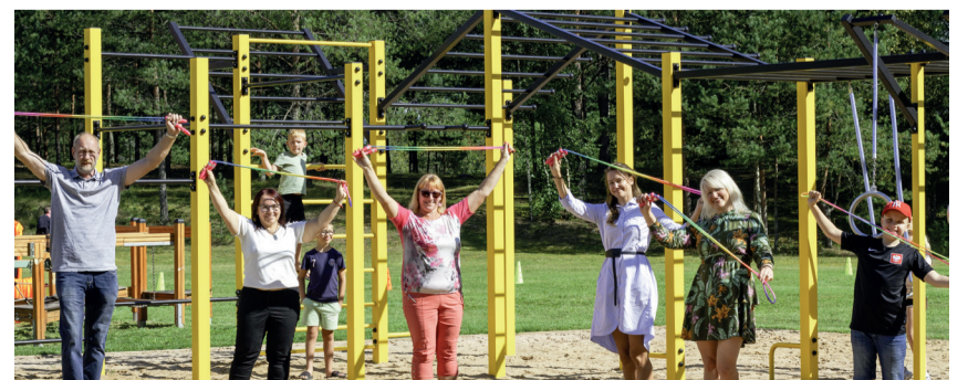
Osula puhkeala ja atraktsioonide avamine.