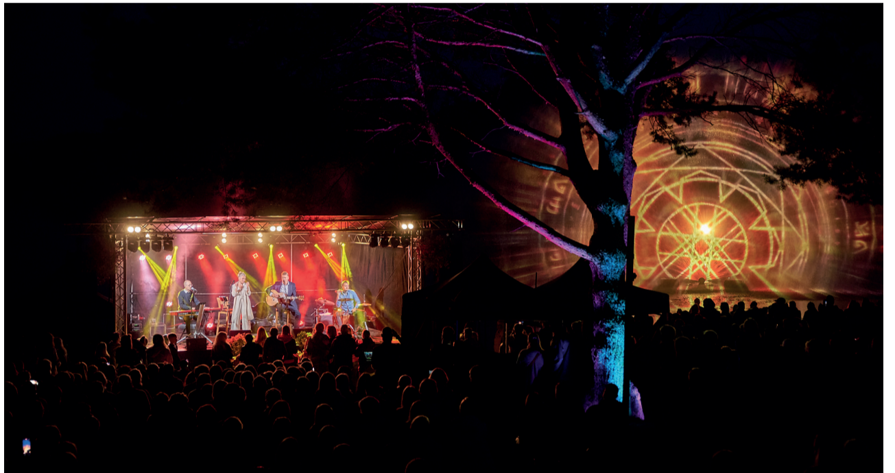
Lasva järvemuusika-festivali öhtune kontsert.

„20 aastat on Lasva kogukonna inimesed näinud vaeva selleks, et see sündmus saaks korduda taas ja taas. Täna kõiki neid, kes on