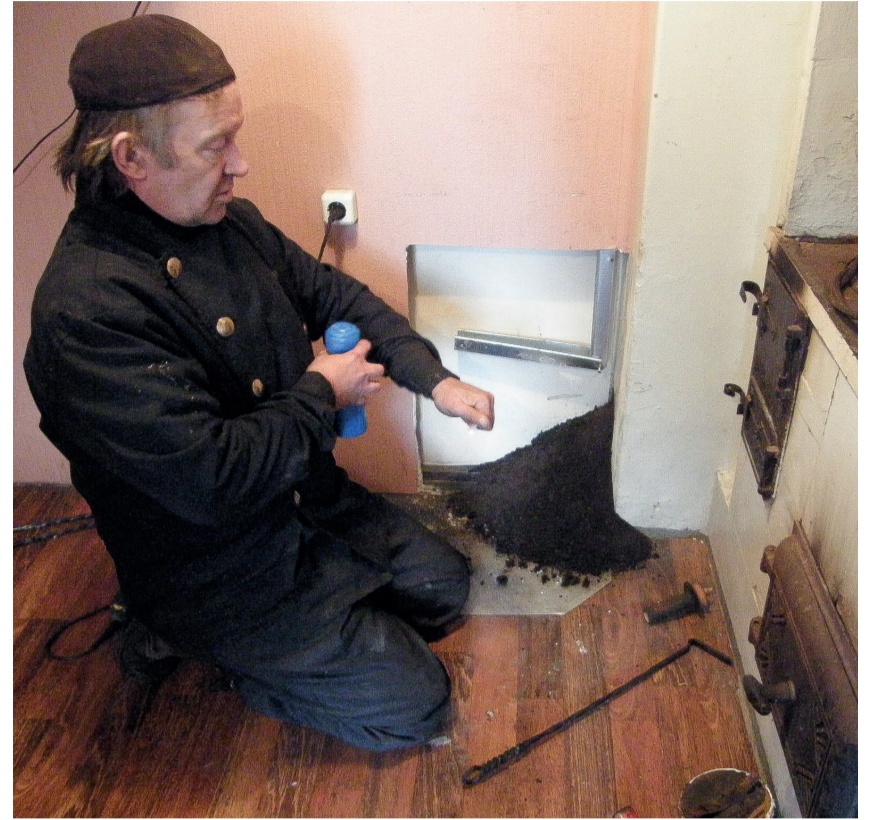
Puhastamata jäetud lõõridesse kogunev tahm on tuleohtlik.

Eramaja korstna peab iga viie aasta tagant üle kontrollima