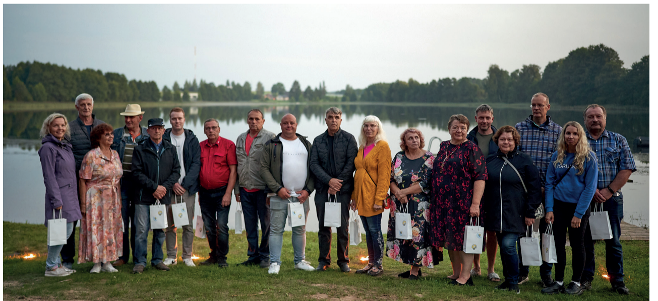
Lasva järvemuusika-festival on saanud toimuda 20 aastat just tänu neile inimestele.

suutnud hoida järjepidevust selle ürituse korraldamisel ja soovin, et Lasva järvemuusika-festival kestaks veel aastaid,” ütles Võru vallavanem Kalmer Puusepp Lasva järvemuusika-festivali tervituskönes.