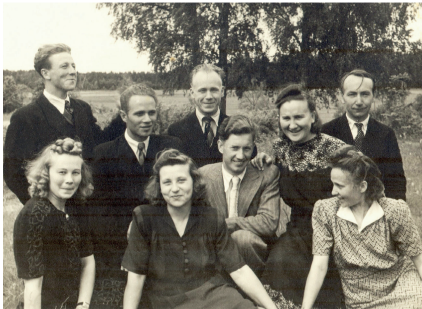
Noored Vastseliina kooliõpetajad on eevil – nende koolist saab keskkool.

Kui 1947. aastal muudeti Vastseliina 7-klassiline Mittetäielik