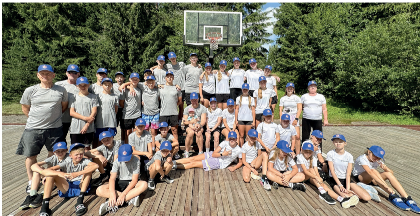
Parksepa spordiklubi õpilased Kurgjärvel.