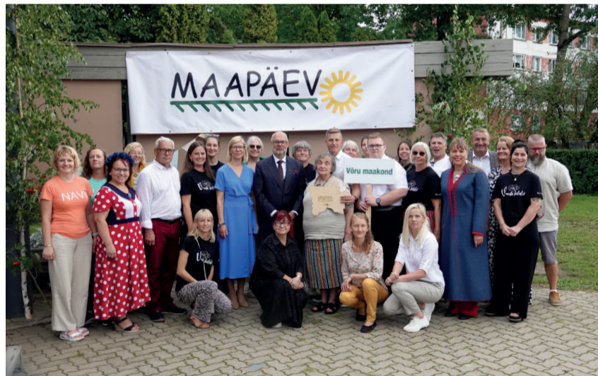
Võru maakonna esindajad Maapäeval koos president Alar Karisega.