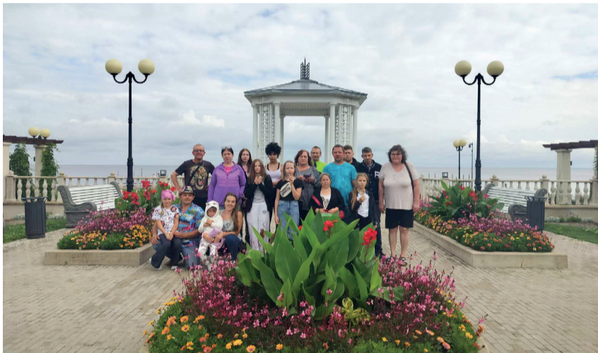
Kündja külaseltsi reiselised Sillamäe promenaadil.